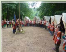
Dub nad Moravou