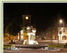
Němčice nad Hanou