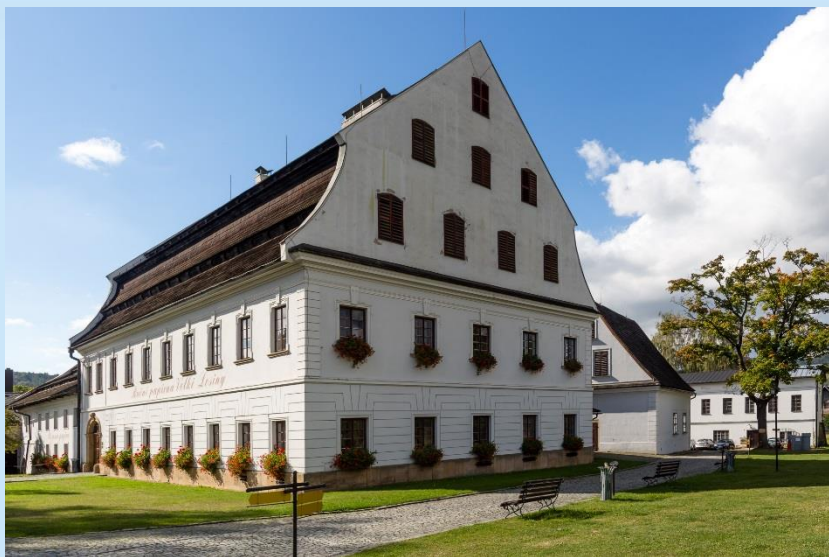
Ruční papírna Velké Losiny