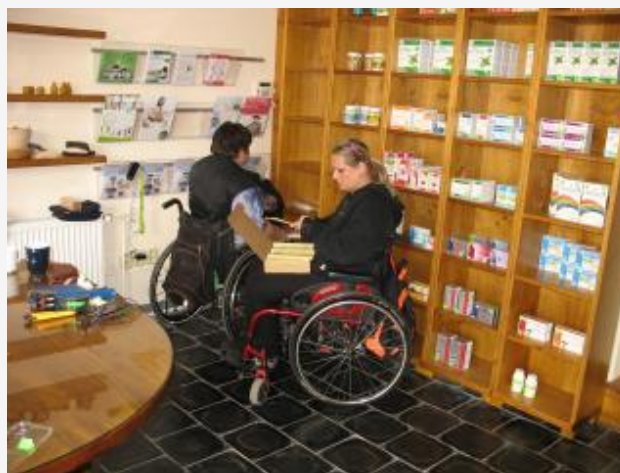
Přirozenou cestou s.r.o.