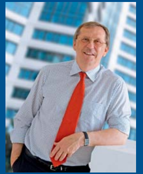
Martin Tesařík hejtman Olomouckého kraje

Všechny vaše podněty rádi přivítáme na adrese tiskove.oddeleni@kr-olomoucky.cz .