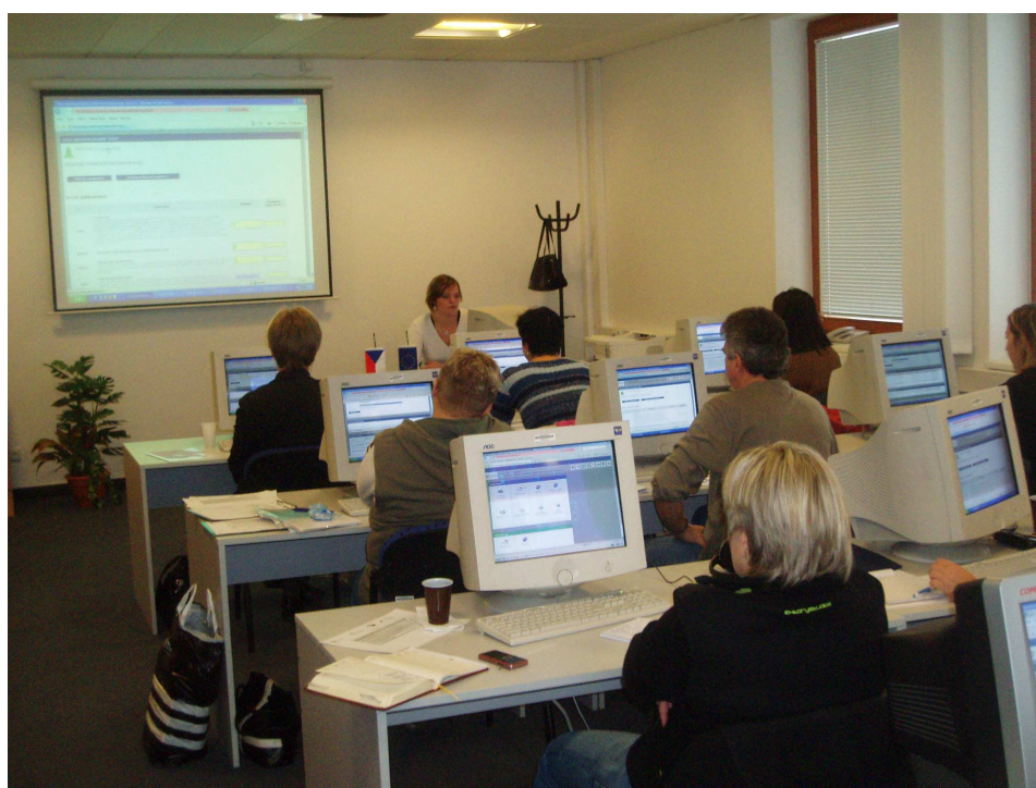
Obr. 13: Účastníci jednoho ze seminářů k práci s aplikací