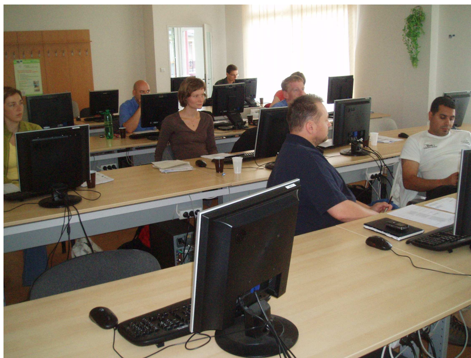
Obr. 7: Úvodní setkání PS 7

Uskutečnění schůzek demonstruje Příloha 6a: Protokoly o realizaci 1. schůzek PS , které obsahují pozvánky s programem a prezenční listiny a Příloha 6b.: Upravené metodiky - Verze 1.