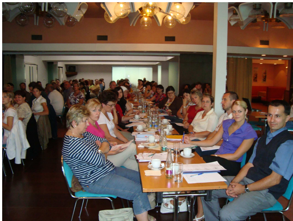
Obr. 12: Účastníci informačního semináře

Seminář měl vysokou účast - 103 pracovníků poskytovatelů sociálních služeb a 2 zástupci KÚ OK, kteří obdrželi jako podkladové materiály vytištěné metodiky jednotlivých typů služeb. Manuál k aplikaci byl zveřejněn na webových stránkách KÚ Olomouckého kraje.