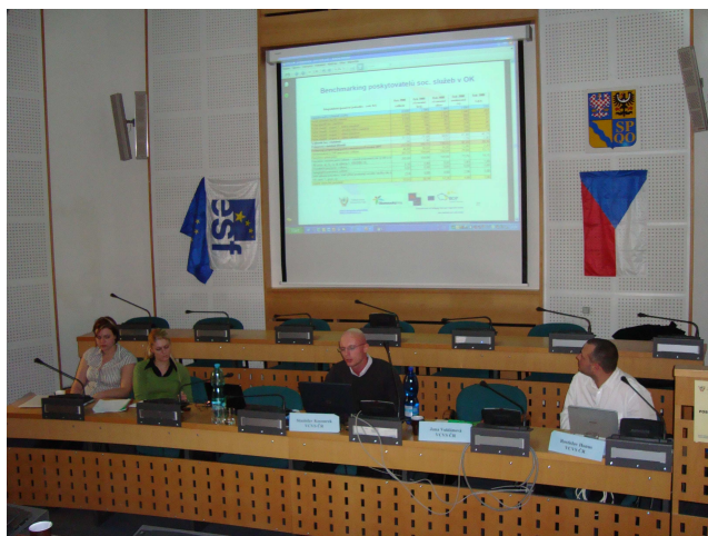
Obr. 13: Účastníci Závěrečného semináře