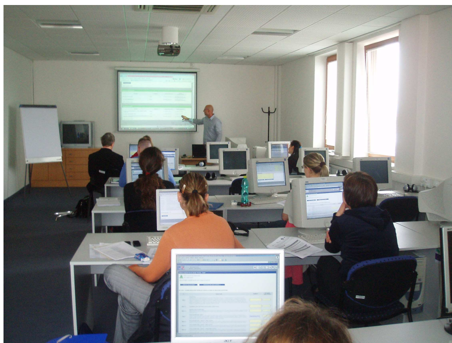
Obr. 6: Úvodní schůzka PS 2 – nácviu obsluhy aplikace

Ve druhé části schůzek byly členům PS představeny konkrétní definice dat a ukazatele specifické pro jednotlivé agendy, které byly poté diskutovány; navrhované změny byly promítnuty do návrhu úpravy metodik.