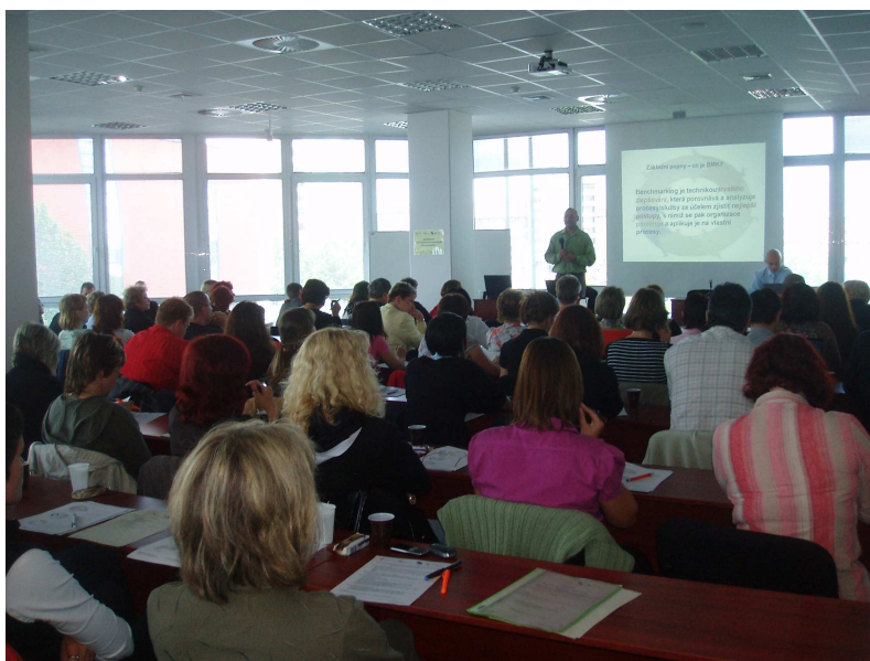
Obr. 4: Účastníci úvodního proškolení v benchmarkingu a metodice

Účastníci obdrželi vytištěné formuláře jednotlivých metodik.