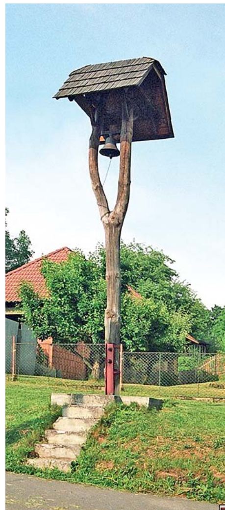
■ Zvonička v Klokočí

Na začátku činnosti mikroregionu to bylo zavedení výpočetní techniky a internetu do knihoven, další byl rozvoj cyklostezek a nakládání s odpady. Všechny tyto projekty se podařilo zdárně uvést do života a s určitými změnami fungují do dnešní doby. V současné době pracuje mikroregion zejména v oblasti kulturní. Společně pořádáme zájezdy do divadla a poznávací zájezdy po krajích naší republiky. Jednotlivé členské obce pořádají své již tradiční kulturní a sportovní akce, kde se vzájemně podporujeme v další činnosti. »red