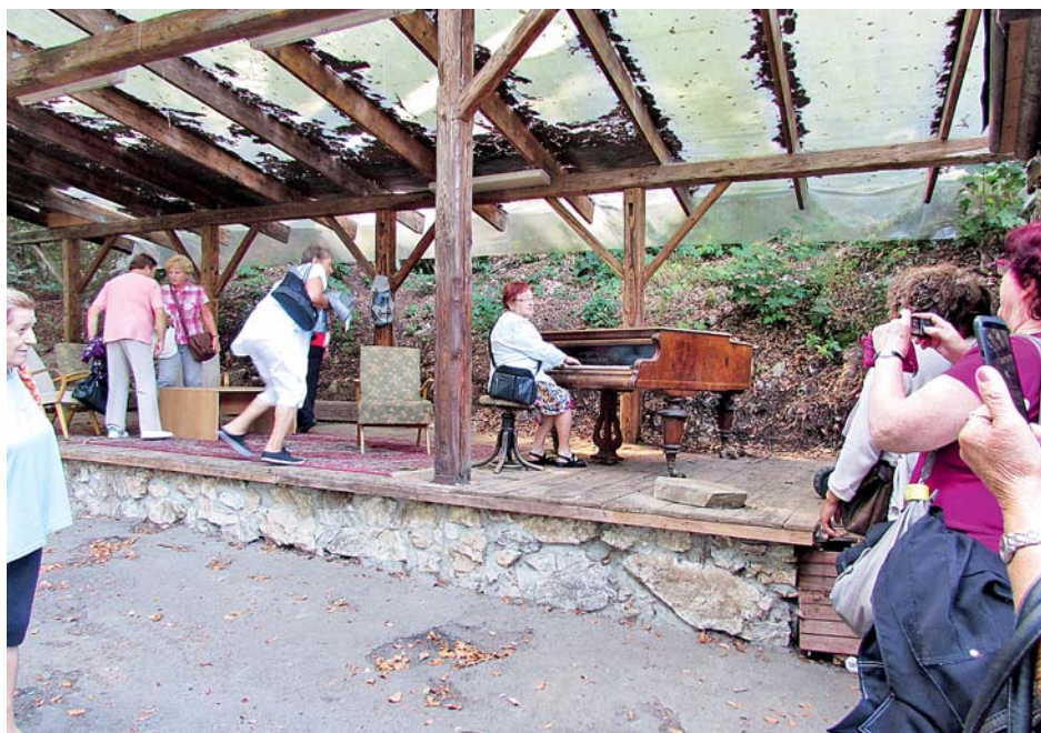
■ Senioři si užívají nejen zajímavé destinace, ale především společné trávení volného času.

Organizační část celého projektu má na starosti vždy cestovní kancelář, která zvítězí ve veřejném výběrovém řízení.