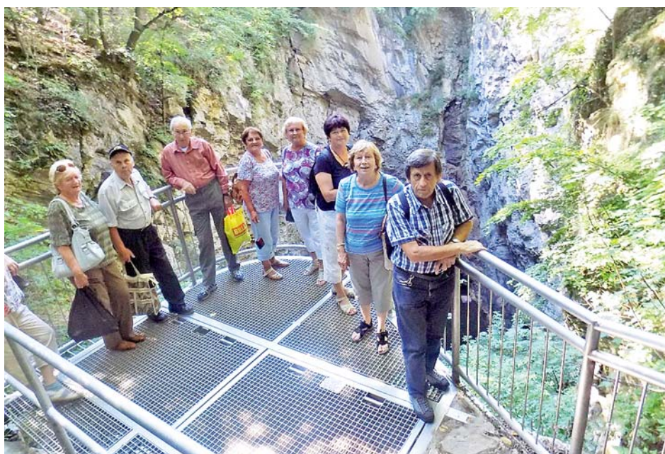
■ Výlet k Hranické propasti patřil k těm fyzicky náročnějším.

Pořádající cestovní kancelář letos vsadila také na rozmanité průvodce. Seniorům se věnovali na