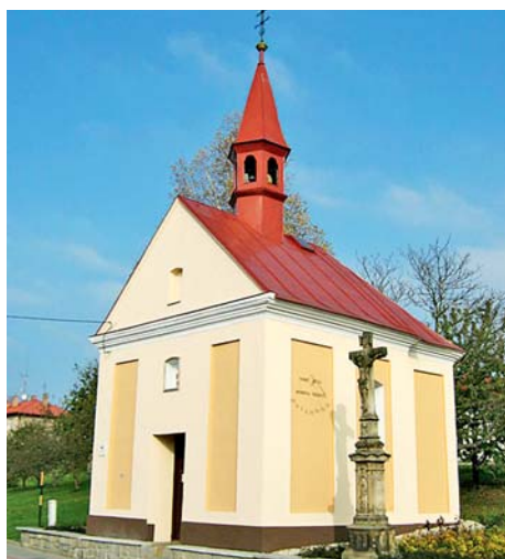
■ Kaplička v Milenově

Co bylo impulzem pro vznik mikroregionu Podlesí a jaké byly jeho cíle?