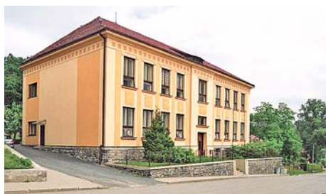
■ Mateřská škola v Hrabůvce

Mikroregion vznikl původně z potřeby vzájemné kulturní a ekonomické spolupráce. Ve spojení obcí jsme viděli předpoklad, že dosáhneme na dotační tituly, které by byly vhodné pro všechny obce. I když jsme malým mikroregionem, pravidelně se schází valná hromada, kde si členové sdělují informace z jednotlivých členských obcí a plánujeme další aktivity.