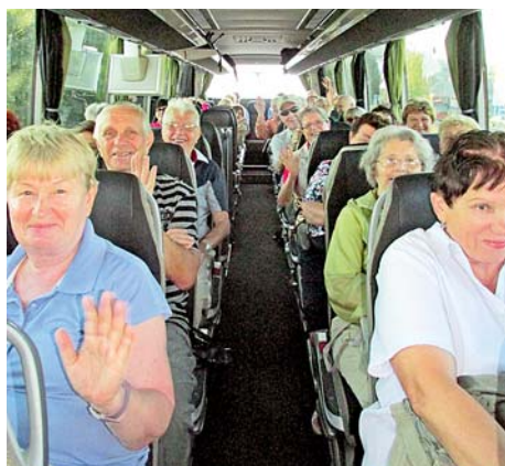
■ Senioři si pochvalovali i přístup dopravců.

zájezdech například studenti Univerzity Palackého s praxí průvodců, ale díky Krajské radě seniorů i průvodci z jejich řad. Poprvé v historii projektu byl pilotně zařazen speciálně upravený výlet pro seniory se zdravotním omezením. Tohoto výletu do Velkých Losin se zúčastnilo 47 seniorů z Olomouce, Zábřehu, Velké Bystřice, Přerova či Litovle. „Krajská rada seniorů se do celého pro-