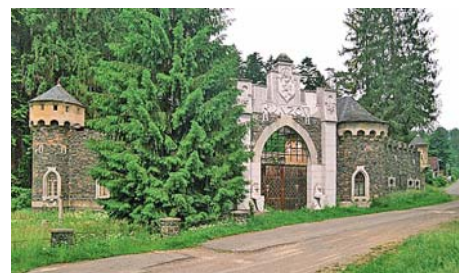
■ Hrádek Kunzov