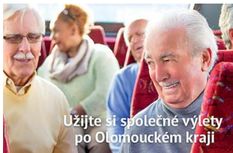
Užijte si společné výlety po Olomouckém kraji

Olomoucký kraj ve spolupráci s Krajskou radou seniorů i v letošním roce připravuje oblíbené zájezdy za dotovanou cenu pro obyvatele kraje starší šedesáti let. Letos už podeváté se mohou senioři zúčastnit sedmdesáti výletů do zajímavých míst kraje. „Letošního ročníku seniorského cestování se bude moct zúčastnit více osob – příspěvky kraj poskytne pro tři tisíce lidí. Účastníci uhradí pouze 200 korun v zájmu