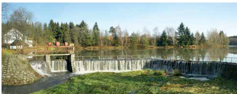
■ Panský rybník v Rozstání