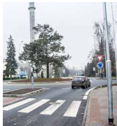
■ Nový rondel zvýšil bezpečnost chodců a cyklistů.

V závěru roku se podařilo předat do užívání řidičům dvě důležité dopravní stavby. Přímo v Šumperku byla dokončena rekonstrukce křižovatky v centru města. Průsečná křižovatka ulic Temenická, Šumavská a Prievidzská se změnila na kruhový objezd. „Rekonstrukci křižovatky považují za velmi dobrou zprávu pro všechny občany. Olomouckému kraji se ve spolupráci s městem Šumperk podařilo zajistit lepší technický stav stávající komunikace, vytvořit novou okružní křižovatku a vyhradit jízdní pruhy pro cyklisty v každém směru. Veškeré opravy by měly přispět k výraznému zklidnění dopravní situace a k větší bezpečnosti pro všechny účastníky silničního provozu,“ uvedl hejtman Jiří Rozbořil. V rámci rekonstrukce byly upraveny i navazující ulice včetně nového provedení chodníků, veřejného osvětlení a veřejné zeleně. Kromě toho je na ulici Šumavská nově zřízen také autobusový zastávkový pruh. Investice do úprav dosáhly 14 milionů korun a podílely se na nich ROP Střední