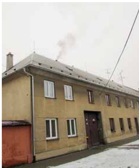
■ Kotlíkové dotace jsou určeny především pro starší domy na vesnicích.

O lomoucký kraj poprvé vyhláší tzv. kotlíkovou dotaci. Mezi obyvatele je připraven rozdělit přes 166 milionů korun. O dotaci na výměnu starých kotlů mohou žádat vlastníci nebo spoluvlastníci rodinných domů od 22. února do 13. května. Dotace z Operačního programu Životní prostředí 2014–2020 je určena na výměnu starých kotlů za moderní ekologické typy.