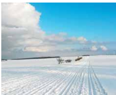
■ Běžecké trasy v okolí Protivanova | Foto: archiv městyse Protivanov

a stavební odpad v městyse Protivanov. Pro náš region je specifické sportovní vyžití na kolech. Naším záměrem je tedy přistoupit k řešení vybudování cyklostezek propojující jednotlivé obce mikroregionu. Na území mikroregionu Protivanovsko se v současné době nenachází žádné zařízení sociální péče. Do budoucna proto máme v plánu přestavby či výstavby objektů pro domovy důchodců či domy s pečovatelskou službou s návazností na sociální služby v domácnostech. »red