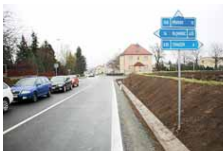
■ Silnice v Dubu nad Moravou byla nejnáročnější stavbou roku 2015.