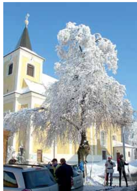
■ Drahan – zima

V příštím období se zaměříme zejména na užší spolupráci obcí při nakládání s odpady. Pracujeme na lepším využití nově vybudovaného sběrného dvora pro tříděný, biologický, nebezpečný