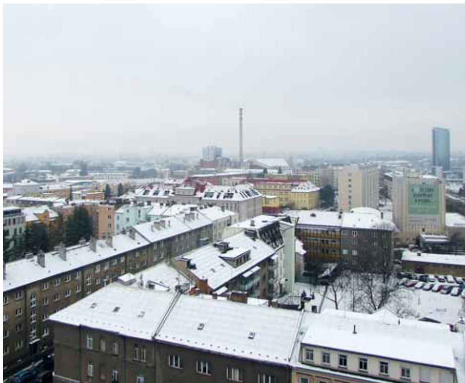
■ Smog stále více trápí i krajskou metropoli. Díky dotacím se má ovzduší zlepšit.

www.kr-olomoucky.cz/kotlikovedotace www.kr-olomoucky.cz/dotace2016