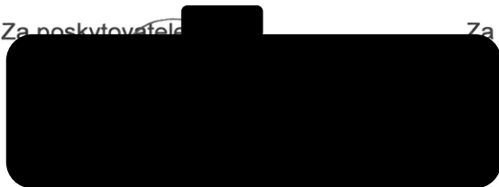
Michal Záša náměstek hejtmána