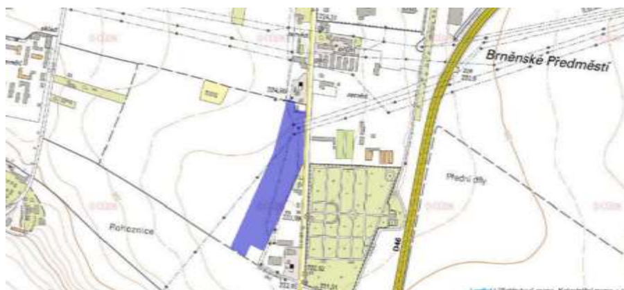
Pozemek p.č. 6406/1 v k.ú. Prostějov

Jako nejvhodnější se jeví s ohledem na dostupnost centra města a zároveň blízkost nájezdů na dálnici D46 pozemek p.č 6406/1 v k.ú. Prostějov. Pozemek má výměru 42 668 m 2 a je v majetku Statutárního města Prostějov.