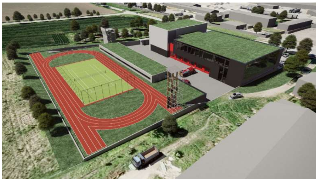
Vizualizace areálu požární stanice Přerov a sídla územního odboru Přerov

Areál zaujímá plochu 9 600 m 2 a bude umístěn na okraji města Přerova