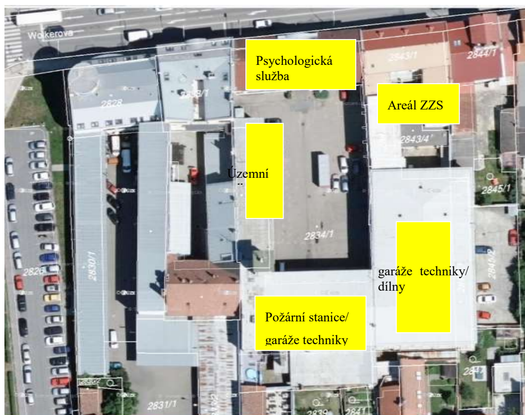
Charakter jednotlivých objektů v areálu HZS v Prostějově

Na areál HZS navazuje objekt výjezdového stanoviště Zdravotnické záchranné služby Olomouckého kraje.