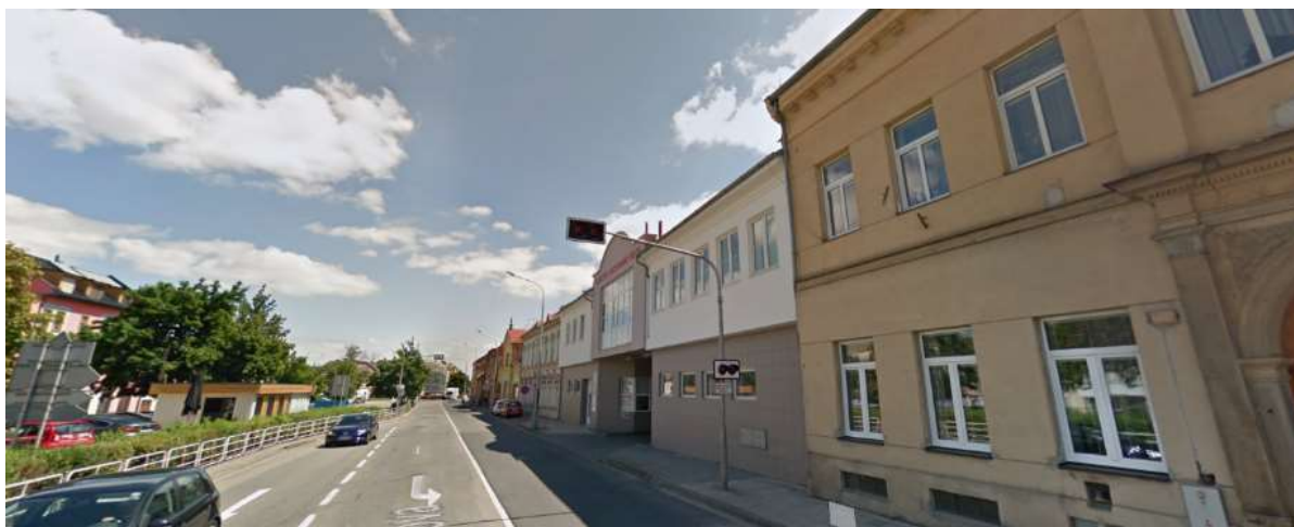
Výjezd do ul. Wolkerova

Požární stanice Prostějov je kategorie C2 (dle vyhlášky č. 247/2001 Sb., o organizaci a činnosti jednotek požární ochrany ve znění pozdějších předpisů). V jednotce je zařazeno celkem 45 příslušníků a velitel požární stanice. V každé 24 hodinové směně je zařazeno 15 příslušníků.