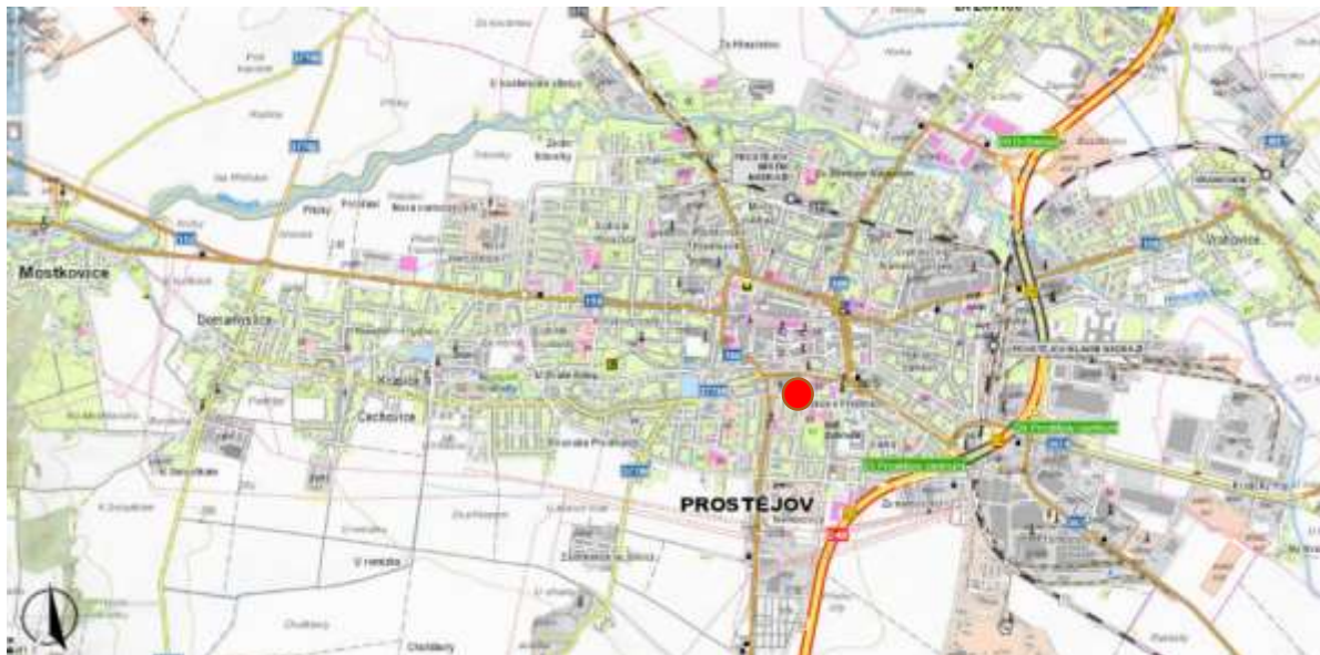
Současné umístění požární stanice Prostějov

Areál požární stanice a sídla územního odboru se nachází v centru Prostějova na ulici Wolkerova.