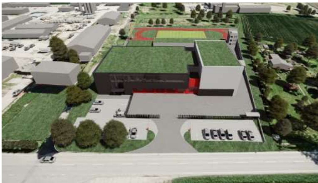
Vizualizace areálu požární stanice Přerov a sídla územního odboru Přerov

Projektovaná cena areálu dosahuje výše 245 627 tisíc. Pozemky pro výstavbu byly získány změnou práva hospodaření v rámci majetku ČR. Výstavba je realizována v rámci Integrovaného operačního programu.