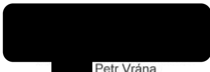
Petr Vrána náměstek hejtmana