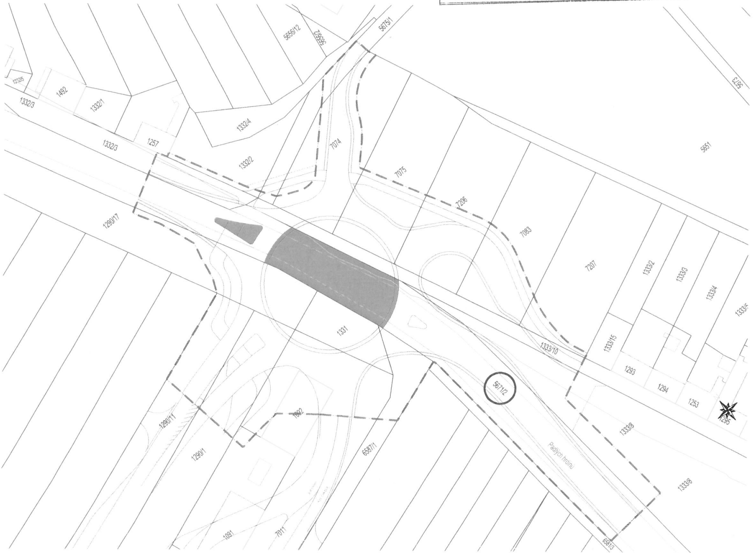
■ Zábory pozemků Olomouckého kraje - Předávány do vlastnictví Accolade