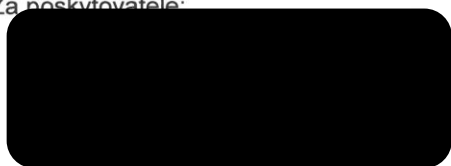
Michal Záchra náměstek hejtmana