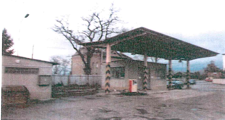
Pohled na zpevněnou plochu