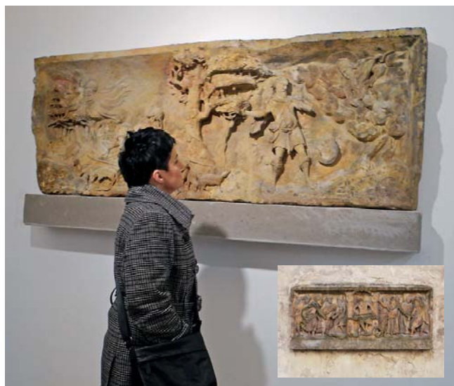
Reliéfní deska před a po restaurování.

Kamenné desky jsou zhotoveny z maletinského pískovce a jejich