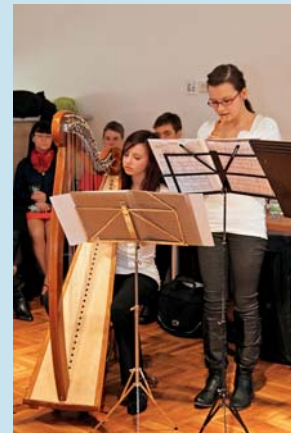
Kraj podpoří významné kulturní akce. Foto | MK příspěvků z kraje ve výši 650 tisíc korun pro veřejnost zrealizuje festival Divadelní Flora. | KR

Mezi příjemce krajské podpory patří například Moravská filharmonie, která získala 550 tisíc korun na organizaci Mezinárodního hudebního festivalu Dvořákova Olomouc. Univerzita Palackého za 900 tisíc korun z krajského rozpočtu připraví další ročník Academia Film Olomouc, zatímco Divadlo Konvikt díky finančnímu