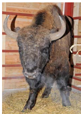
Zubři patří v Evropě mezi největší savce.

Svatý Kopeček • Ve druhé polovině ledna překročil bránu olomoucké zoologické zahrady první obyvatel nového výběhu zubrů, samec Bojen. Nyní se z jeho společnosti těší samice Rosemarie a do právě vznikajícího Safari přibude ještě samice Božka. Zoo se tak se zubry vítá