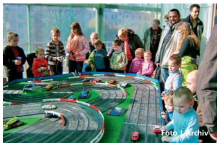
Výstava potěší malé i velké návštěvníky.

Olomouc • Začátek března bude na olomouckém výstavišti Flora patřit všem, co si rádi hrají. Příznivci modelování z papíru, plastu, dřeva či jiných materiálů a sběratelé nejrůznějších kuriozit obsadí od 1. do 3. března výstavní pavilony E, G a H. V pořadí již 11. ročník výstavy modelů a sběratelství FOR MODEL představí v kapesním vydání historické bitevní lodě,