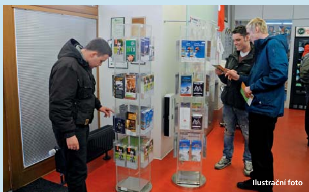
Informační centra dostanou peníze na kvalitnější provoz.

Olomoucký kraj • Na zkvalitnění služeb turistických informačních center v kraji přispěje hejtmánství letos částkou 800 tisíc korun. Poskytnutá dotace je určena na zlepšení jejich vybavenosti a kvalitnější provoz.