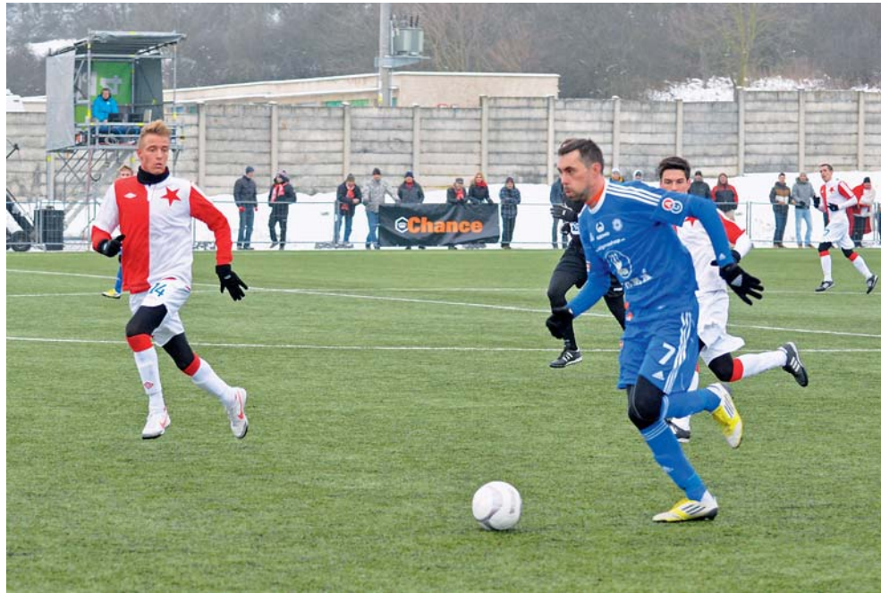
Sigma měla prvenství i letos na dosah, ve finále však podlehla pražské Slavii.

My jsme nastoupili s mladšími hráči, protože v sobotu hrálo více hráčů základní sestavy. Zápas byl pro nás složitější, protože Slavia proti nám vystřídala 23 hráčů. Zlomilo se to v druhém poločase, kdy jedno mužstvo bylo čerstvé a druhému postupně ubývaly síly,“