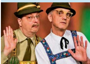
Divadlo Sklep