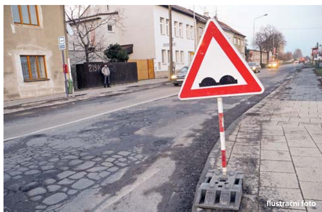
Do oblasti dopravy plánuje hejtmankství investici přes 417 milionů korun.

Olomouc • Olomoucký kraj zahájí v letech 2013 a 2014 realizaci 51 nových investičních projektů ve výši 1,2 miliardy korun. Původně vedení kraje sice hovořilo o konzervativně sestaveném rozpočtu, který nepočítal s novými investičními akcemi, nyní však našlo tři nové zdroje financí. Pomocí by měly vlastní peníze, evropské dotace a finance ze třímiliardového úvěru z Evropské investiční banky. „Jedná se o 25 projektů v oblasti školství, 11 projektů v sociální sféře, 10 projektů v oblasti dopravy a 5 projektů v oblasti zdravotnictví,“ uvedl hejtmank Jiří Rozbořil (ČSSD). V letošním roce by podle něj mělo být zahájeno 35 projektů ve výši přes 422 milionů korun, v roce následujícím zbývajících