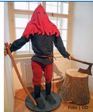
Součástí expozice je i kat a jeho pomůcky.