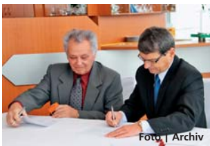
Náměstek hejtmána Radovan Rašák (vpravo)

Olomouc • Náměstek hejtmána Olomouckého kraje Radovan Rašák (ČSSD) podepsal smlouvy se zástupci vrcholových sportovních klubů a oddílů z regionu, kteří získají příspěvek z krajského rozpočtu na celoroční sportovní činnost. Příspěvky za téměř 22 milionů korun schválilo krajské zastupitelstvo 21. prosince.