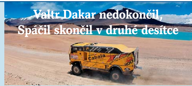
Soutěže se zúčastnili i jezdci z Olomoucka.

la prostor řada mladých hráčů z juniorky. „U nás dostávají mladší hráči prostor, je to pro ně dobrá škola. Ten zápas proti Slavii pro ně samozřejmě byl těžší, protože soupeř byl kvalitní. Ale jsem rád, že kluci mohli takové utkání absolvovat,“ pochvaloval si Pivarník. | MP