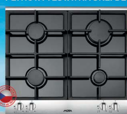
VDP 645 GX PLYNOVÁ VESTAVNÁ SKL. DESKA

akční MOC: 8.990,- Kč v případě setu s VT 538 MX akční MOC: 15.990,- Kč