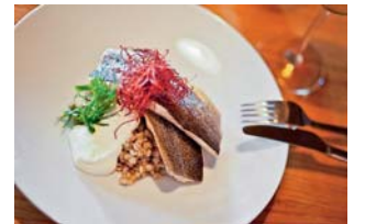
V rámci festivalu lze ochutnat zajímavá menu.

Jeseníky • Občanské sdružení Jeseníky přes hranice, které v letních měsících organizuje již třetí ročník gastronomického festivalu Chuť Jeseníků, letos připravuje nový projekt zaměřený na podporu regionální gastronomie a výrobců z regionu Hané nazvaný „Chuť Hané“. Aktivitu sdružení finančně podpoří částkou 50 tisíc korun Olomoucký kraj, který je partnerem jesenického festivalu.