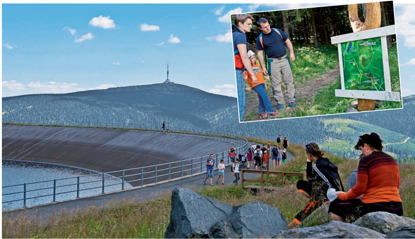
Horní nádrž láká svou atraktivitou i překrásnými výhledy.