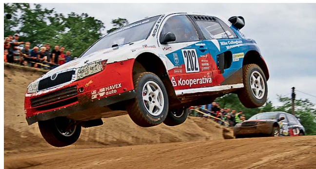
Na závodech se setkají jezdci z celé Evropy.

Přerov • Pořadatelé Auto Klubu Přerov město v ČR zvou všechny příznivce špičkového autokrosu na sedmý podnik letošního Evropského šampionátu, který se koná 24. a 25. srpna. Vzhledem k tomu, že se ME v autokrosu jede na Přerovské rokli každoročně již od roku 1997, pořadatelé očekávají účast až 90 jezdců ze 16 zemí celé Evropy. Zdejší trať patří mezi ty nejrychlejší a navíc s nejvyšším pře-