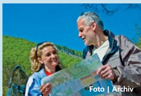
Senioři se mohou vydat za kulturou nebo za sportem.

Olomouc • Do konce srpna mohou senioři využít nabídku kulturních či sportovních aktivit, které pro ně zdarma připravily v rámci projektu „Senioři bez hranic“ neziskové organizace. Od letošního června navštívilo více než 300 seniorů 22 aktivit, zavítali například do Botanické zahrady Univerzity Palackého v Olomouci, absolvovali pochod za kulturními památkami i besedu se zá-