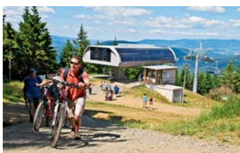
Až na Medvědí horu se lze pohodlně dopravit lanovkou.

dva kilometry dlouhou novou naučnou stezku nazvanou Rysí skála. „Dne 28. září proběhne v areálu 1. ročník extrémního horského duathlonu – Koutyman a v zimní sezoně zde bude otevřena zbrusu nová modrá lyžařská sjezdovka pojmenovaná Pohodová. Její délka přesáhne 3 kilometry a stane se tak třetí nejdelší v Česku,“ prozradil připravovaný novinky Petr Marek. Podrobné informace k organizaci návštěv elektrárny a online rezervaci jsou pro zájemce k dispozici denně od 9 do 16 hodin na telefonní lince 585 283 282, 602 322 244 nebo na www.dlouhe-strane.cz . | DD