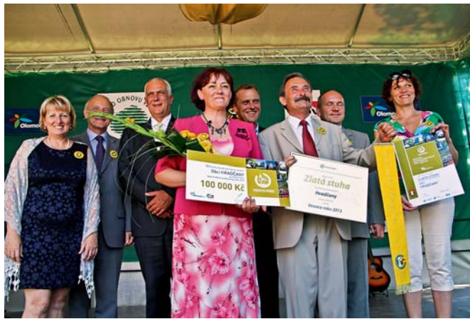
Zlatou stuhu převzali představitelé obce Hradčany.