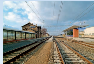
Dodavatel: Skanska DS, a.s.