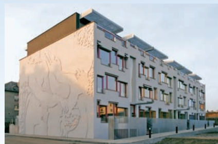
Autor: Roman Koucký, architektonická kancelář, s.r.o. Investor: Město Šternberk