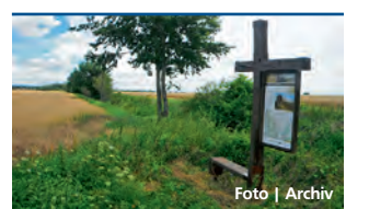
Informační panely mají tvar křížů.

Veska, Olomouc • Golfový turnaj za účasti přední české golfistky Kláry Spilkové a divadelní představení pro veřejnost připravuje občanské sdružení SPOLU, které podporuje lidi se zdravotním, primárně s mentálním postižením v Olomouckém kraji. Golfový turnaj odstartuje v pátek 17. května na golfovém hřišti ve Věsce u Olomouce. Společné divadelní představení českých a německých herců s mentálním postižením se uskuteční ve čtvrtek 30. května v 17 hodin v koncertním sále ZUŠ Žerotín v Olomouci. Více na www.spoluolomouc.cz. | KR