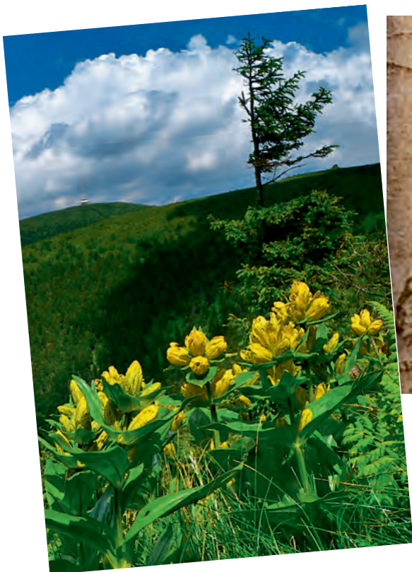
Navštivte Jeseníky, zoologickou zahradu nebo Rychlebské stezky.

Olomoucký kraj • Turistická lákadla v Jeseníkách a na Střední Moravě zprostředkuje zájemcům takzvaná roadshow, která odstartovala ve čtvrtek 25. dubna v Olomouci a postupně putuje po městech v Česku, Slovensku a Polsku. Prostřednictvím průvodců, map, letáků, soutěží a her či ochutnávek regionálních specialit představí lidem atraktivitu našeho kraje. Mezi novinky letní turistické sezony náleží například mobilní aplikace, která je spojením turis-