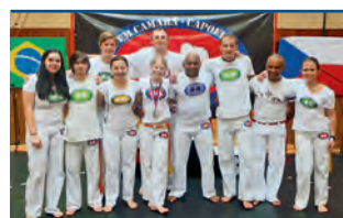
Olomoucká capoeira si dovezla medaili.