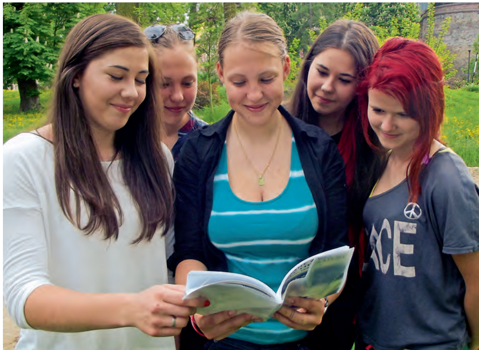
Studenti mají možnost se vzdělávat v zahraničí.

Olomouc • Získat vysokoškolské vzdělání v zahraničí v oborech důležitých pro hospodářský rozvoj kraje a přinést nabyté mezinárodní know-how do regionu. To je cílem zavedení specializovaného inovačního stipendia Olomouckého kraje. Stipendium je určeno absolven-