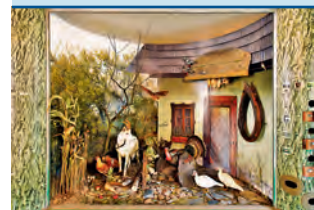
Expozice Příroda Olomouckého kraje.

Chorzów, Šumperk • V sobotu 20. dubna převzal v polském Chorzowě ředitel festivalu Blues Alive Vladimír Rybička významnou cenu. Čtenáři prestižního časopisu Twój Blues hlasováním v anketě Blues Top rozhodli o tom, že festival byl vyhlášen nejvýznamnější bluesovou událostí ve světě. | MP