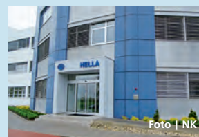
Příspěvek obdrží také mohelnická Hella – Autotechnik.

Olomouc • Olomoucký kraj, statutární město Olomouc a Regionální rada ROP Střední Morava podpoří celkem 44 inovačních projektů. Podpora bude mít podobu takzvaných inovačních voucherů, jimiž firmy mohou platit za spolupráci s vědeckovýzkumnými institucemi. Těmi mohou být mimo jiné výzkumné ústavy či vysoké školy. Například mohelnický výrobce komponentů pro vozidla Hella – Autotechnik získá 150 tisíc korun na projekt Materiálové inovace světlo- metů, na němž se bude podílet s Univerzitou Tomáše Bati. Společnost Ekoprogress Hranice získá stejnou sumu na spolupráci s Univerzitou Palackého týkající se využití nanočástic při zahušťování kalů čištění odpadních vod. Podpora 44 projektů bude stát