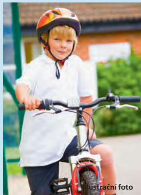
Peníze poputují také na údržbu dětských dopravních hřišť.

Z příspěvku Olomouckého kraje bude 460 tisíc určeno na dopravní výchovu včetně vybavení hřišť a 287 tisíc korun na akce s policií, přednášky pro veřejnost, semináře a dopravní soutěže dětí. Na podobný účel Olomoucký kraj přispěl také loni, a to částkou 750 tisíc korun. V roce 2012 v Olomouckém kraji ve srovnání s předcházejícím