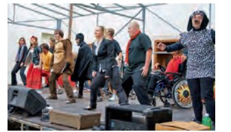
Publiku se představí čeští i němečtí herci.

v konceptu zhruba deseti krátkodobých výstav ročně. V plánu máme i naplňování výstavního programu SEFO, tedy představování moderního umění středoevropských států. Důležité bude i rozhodnutí, jak budeme orientovat zamýšlené Trienále středoevropského umění. Po 40 letech se Olomouc také dočká otevření stálé expozice moderního umění, neboť nedávná výstava Od Tiziana po Warhola nám ukázala, jak velký zájem je o naše kvalitní sbírky. Zvláštní pozornost chci věnovat i vědecko-výzkumné práci a její prezentaci. Chystáme pokračování výstav, které představí sbírky Muzea moderního umění, ale zpracování a vystavení se dočká i vynikající sbírky uložené na Arcibiskupském zámku v Kroměříži, o něž pečuje Arcidiecézní muzeum Kroměříž. Rozpočet Muzea umění Olomouc se v posledních