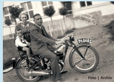
K vidění jsou stroje české i zahraniční výroby.

Vikýřovice • Návštěvníci silničního muzea ve Vikýřovicích mohou až do 15. června zhlédnout výstavu, která je zavede do historie dopravních prostředků, jež se od 20. století pohybovaly na našich cestách a silnicích. K vidění jsou staré motocykly, z nichž některé brázdí naše silnice dodnes. Vystaveny jsou jak čes-