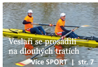
Veslaři se prosadili na dlouhých tratích