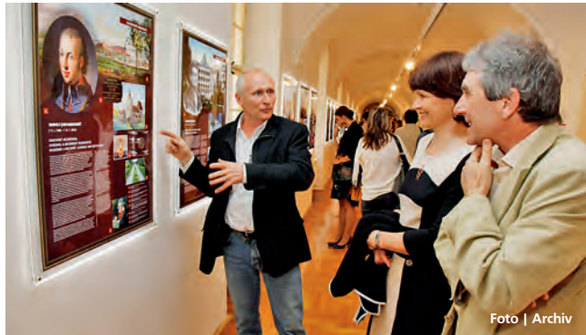
Výstava představuje osobnosti spjaté s regionem Olomouckého kraje.

Olomouc • Panovníci, církevní hodnostáři, umělci, vědci, vojáci i sportovci se představují v nové stálé expozici Vlastivědného muzea v Olomouci nazvané Galerie osobností Olomouckého kraje. Expozice prostřednictvím velkoplošných světelných panelů