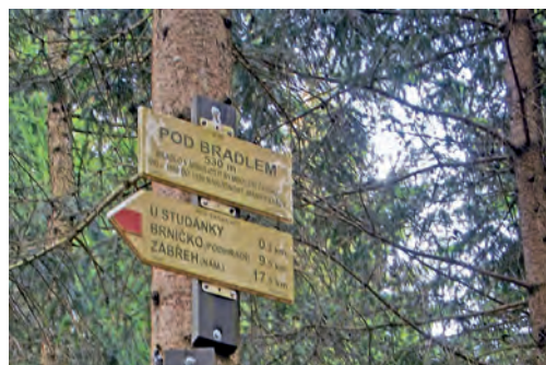
Turistické značky se dočkají obnovy.

Olomoucký kraj • Klub českých turistů získá od Olomouckého kraje příspěvek 400 tisíc korun na obnovu pěších a lyžařských turistických tras.