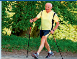
Nordic walking patří mezi oblíbené aktivity. Foto | Archiv