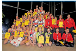
Olomoucké akvabely se neztratily.