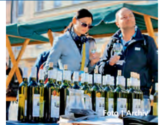
Návštěvníci se mohou těšit na dobré víno.

srovnání jak produkce jednotlivých výrobců, tak úroveň designu mezi Evropou a Amerikou. Československo na výstavě zastupuje řada přístrojů dokumentujících alespoň zčásti velký počet firem, které se v předválečné republice zabývaly výrobou rozhlasových přijímačů. Mezi nimi najdou zájemci přístroje z poválečné éry z rozsáhlého výrobního programu koncertu TESLA (TEchnika SLAboproudá) – svého času jednoho z největších evropských výrobců sdělovací techniky. Mezi několika stovkami exponátů lze spatřit i vysloveně technické rarity. Více informací naleznete na www.veteranarena.cz . | RD