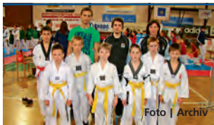
Mladí Škorpioni zabodovali.