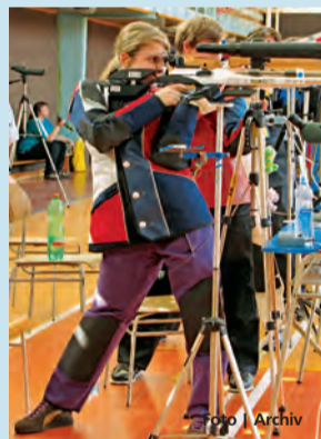
Sportovního maratonu se zúčastnilo 86 závodníků.

Hanušovice • Poslední březnový víkend v Hanušovicích patřil tradičně sportovním střelcům. Členové zdejší ZO AVZO se již podeváté v řadě za sebou stali pořádatelci mistrovství AVZO TSC ČR (Asociace víceúčelových základních organizací technických sportů a činnosti České republiky) ve střelbě ze vzduchových zbraní a této akce se zhostili se ctí. Dvoudenního sportovního maratonu se zúčastnilo 86 sportovních střelců ze 17 organizací AVZO z celé České republiky, kteří v duchu Fair play bojovali o 16 titulů mistr ČR AVZO ve všech věkových kategoriích a v disciplínách vzduchová puška a vzduchová pistole. V silné konkurenci soupeřů se nejlépe dařilo závodníkům z Horní Cerekve, Hanušovic a Šum-