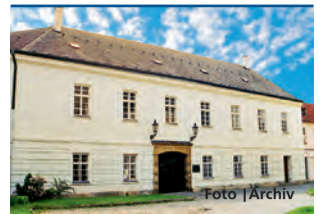
Nové značení bude mít i muzeum v Mohelnici.