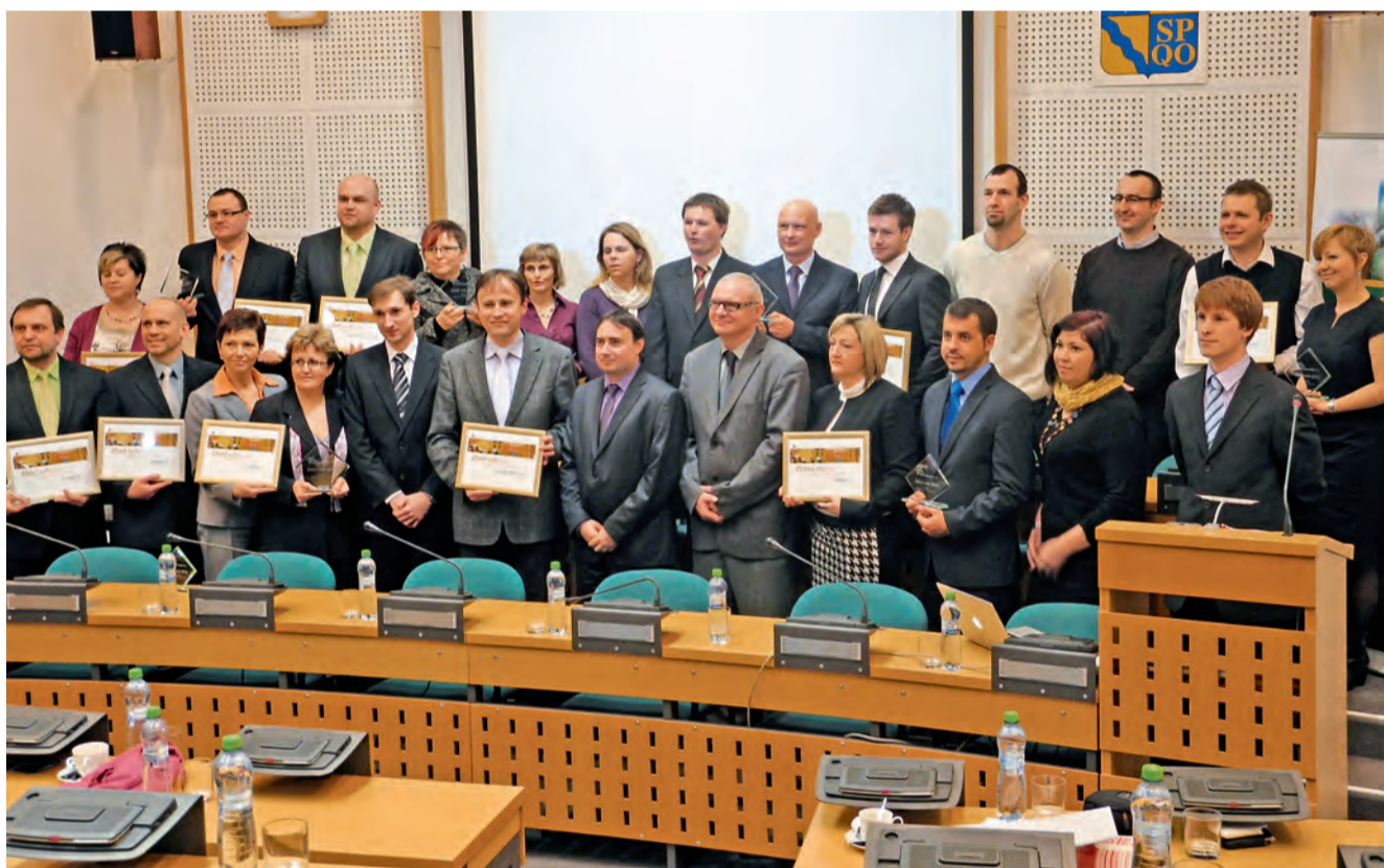
Krajská porota vyhodnotila nejlepší weby a elektronické služby a v sídle hejtmanství předala vítězům ocenění.