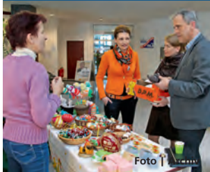
Na výstavu zavítal i hejtman Olomouckého kraje Jiří Rozbořil.