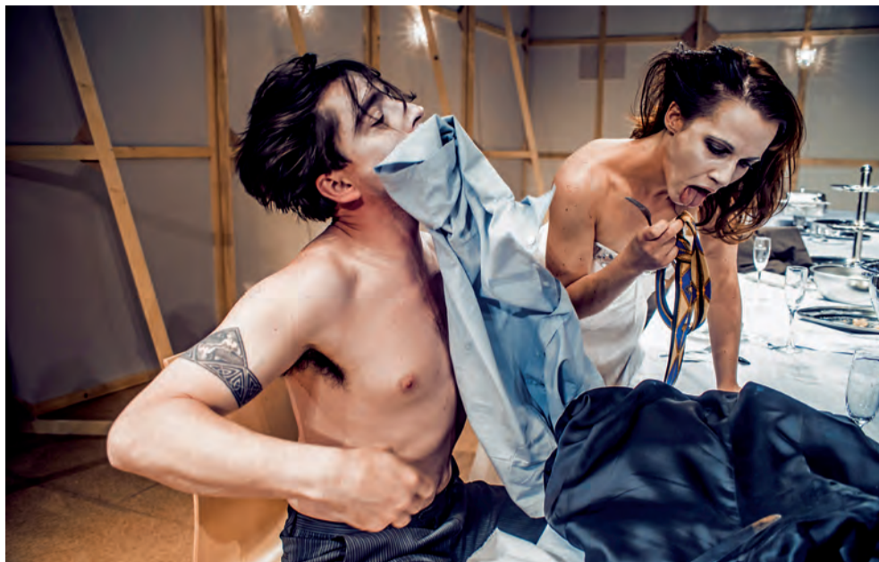
Letošní Divadelní Flora vyvrcholí uvedením jedné z neoriginálnějších českých činoherních inscenací posledních let – provokativní adaptací slavného filmu Luise Buñuela Nenápadný půvab buržoazie brněnského Divadla Reduta a režiséra Jana Mikuláška.