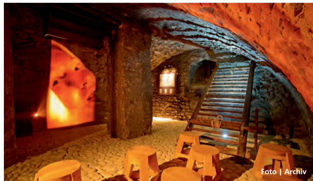
Jesenická expozice o čarodějnických procesech získala Cenu veřejnosti.