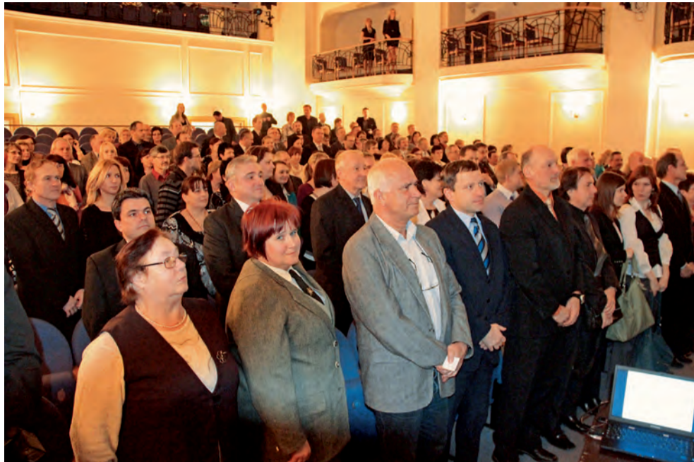
Nejlepší učitelé získali ocenění.