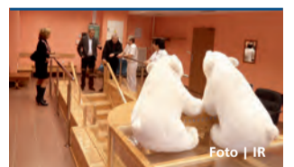
Představitelé kraje si prohlédli lázeňský areál

Olomouc • S částečným omezením dopravy musí počítat řidiči projíždějící olomouckou křižovatkou v Hodolanech v době od 18. března do konce dubna. Důvodem je instalace nového světelného signalizačního zařízení s režimem dynamicky řízeného provozu. IR