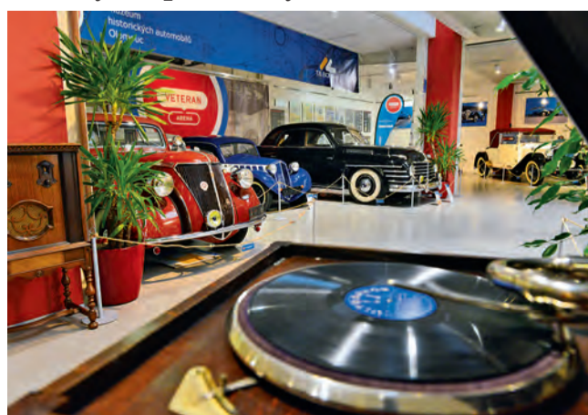
VETERAN ARENA láká na historické exponáty.

Olomouc • Více než šest stovek historických exponátů amerických a evropských radiopřijímačů a gramofonů, které byly zapůjčeny ze soukromých sbírek, vystavuje olomoucké muzeum VETERAN ARENA. Mezi vzácnými exempláři najdou zájemci i jednu z prvních verzí rádií Atwater Kent 10C z roku 1924 ještě s trychtýřovým reproduktorem, známým z počátků výroby fonografů či gramofonů. Nechybí ani další technické rarity v podobě amerických tzv. farmářských radiopřijímačů, unikátních skříňových radiogramfonů či cenami ověřených radiopřijímačů Talisman. Na výstavě, která je za poslední desetiletí největší v České re-