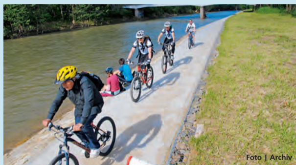
Příspěvek obdrží i pořadatelé 3. ročníku cyklostezka Bečva.

Olomouc • Finanční podporu ve výši 1,5 milionu korun poskytne v letošním roce olomoucké hejtmanství organizátorům akcí nadregionálního nebo mezinárodního významu. Příspěvek z Olomouckého kraje využijí pořadatelé akcí, které tradičně zvyšují návštěvnost v jednotlivých turistických lokalitách v regionu.