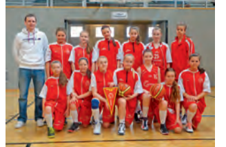
Hráčky si na turnaji vedly skvěle.