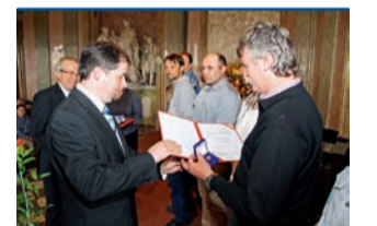
Slavnostní akt se konal v prostorách olomouckého Klášterního Hradiska.

Praha • Téměř šest desítek profesionálních i dobrovolných hasičů z Olomouckého kraje vyrazilo začátkem června na pomoc zaplavené Praze. Záchranáři tam mj. stavěli protipovodňové hráze, velkokapacitním čerpadlem odčerpávali vodu, která se valila na obydlí, či provedli odstřel pontonu na Vltavě. | 10