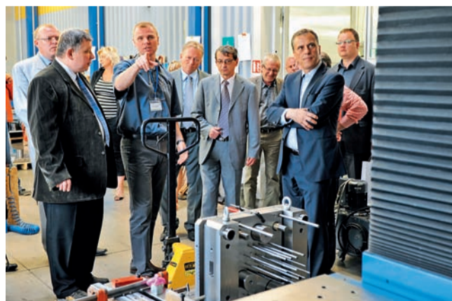
Představitelé kraje zavítali také do strojírenské firmy Linaplast v Kralicích na Hané, která se zabývá zpracováním plastů.