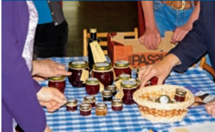
Značky získaly džemy Zory Hájkové.