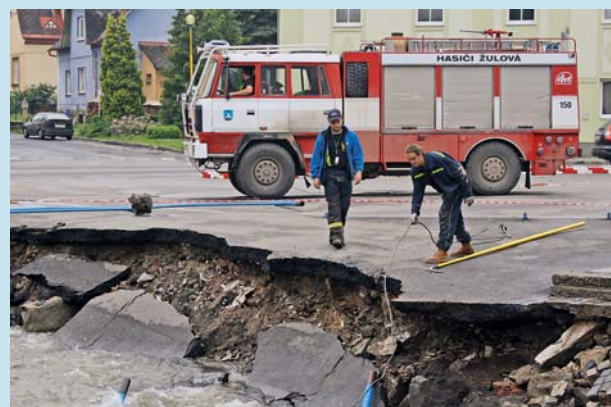
Kraj přispěje hasičům na techniku.