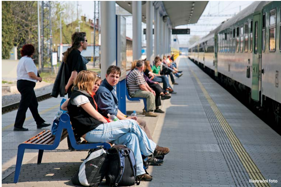
Lidé mohou vybírat z více druhů dopravy, na vybraných tratích platí jeden jízdní doklad pro autobusy i vlaky.

Olomoucký kraj • Integrovaný dopravní systém Olomouckého kraje se od března rozšíří o tři nové železniční trati. Jeho výhodou budou moci nově využít občané na tratích 271, 273 a 297. Projekt připravil Koordinátor Integrovaného dopravního systému Olomouckého kraje (KIDSOK), který funguje od