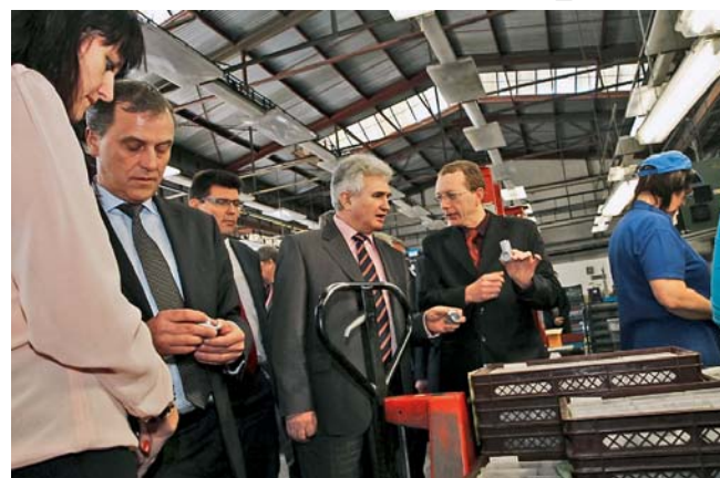
Představitelé kraje zavítali také do zábřežské firmy HDO.

Hejtmán Jiří Rozbořil (ČSSD) a jeho kolegové z krajské rady nejprve debatovali se starosty z obcí správně spadajících pod obec s rozšířenou působností Zábřeh o rozvojových prioritách, dopravní obslužnosti ve vazbě na sousední Pardubický kraj a o nezbytnosti nápravy zanedbané silniční sítě. Starostové se zajímali také o záměry kraje v oblasti likvidace odpadů. Při besedě se studenty zábřežského gymnázia se k hejtmánovi