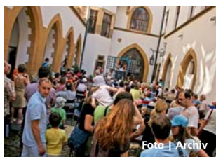
Ekojarmark na nádvoří radnice

Olomouc • Besedy se zajímavými osobnostmi, výlety do přírodních i městských krajín, výstavy, soutěže a akce pro školy budou od 19. dubna součástí festivalu Ekologické dny Olomouc.