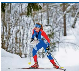
Hana Horvátová Foto | Archiv

„Junioři náš kraj a kluby dobře reprezentovali. Budeme rádi, když přijdou i další zájemci do Omega centra na squashové kurzy a budou s námi trénovat a hrát. Squash je všestranný sport, a počkáme-li do května na zasedání MOV, možná bude i olympijský,” řekl jeden z trenérů SQKM Olomouc. | DA