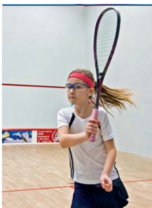
Tereza Šírová