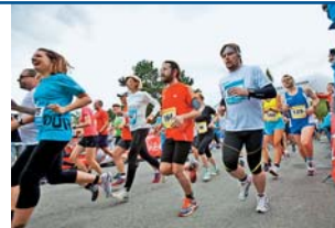
Běžec seriál proběhne i v Olomouci.