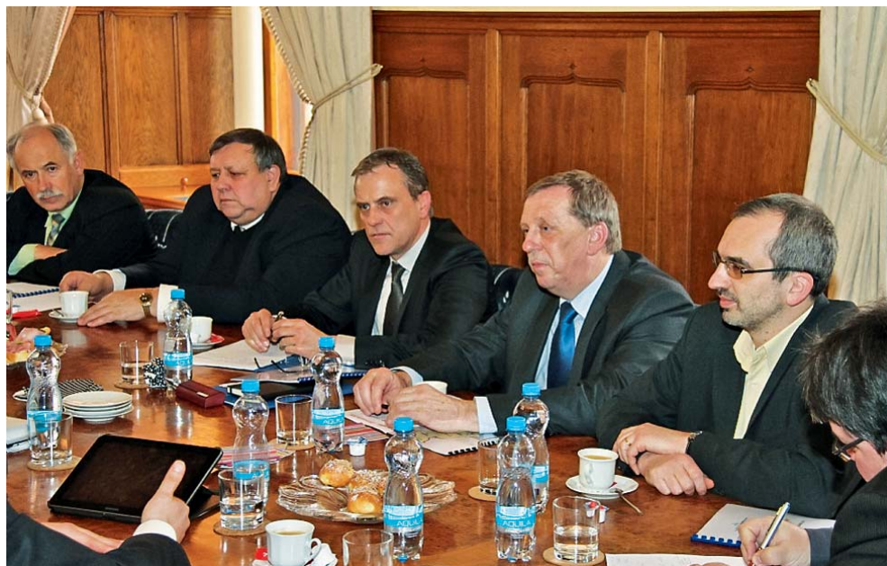
Plány ministerstva obrany se představiteli Olomouckého kraje nezamlouvají.