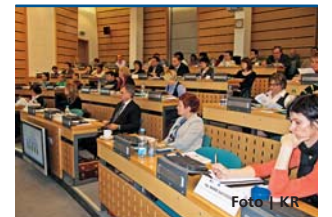
Semináře se zúčastnilo 60 zájemců.