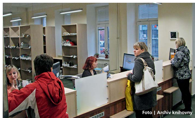
Vědecká knihovna v Olomouci plní v kraji regionální funkce.

Olomoucký kraj • Knihovny v kraji letos dostanou z rozpočtu olomouckého hejtmánství celkem 9 milionů korun.