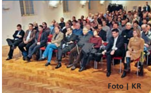
Debata se nesla v poklidné atmosféře.