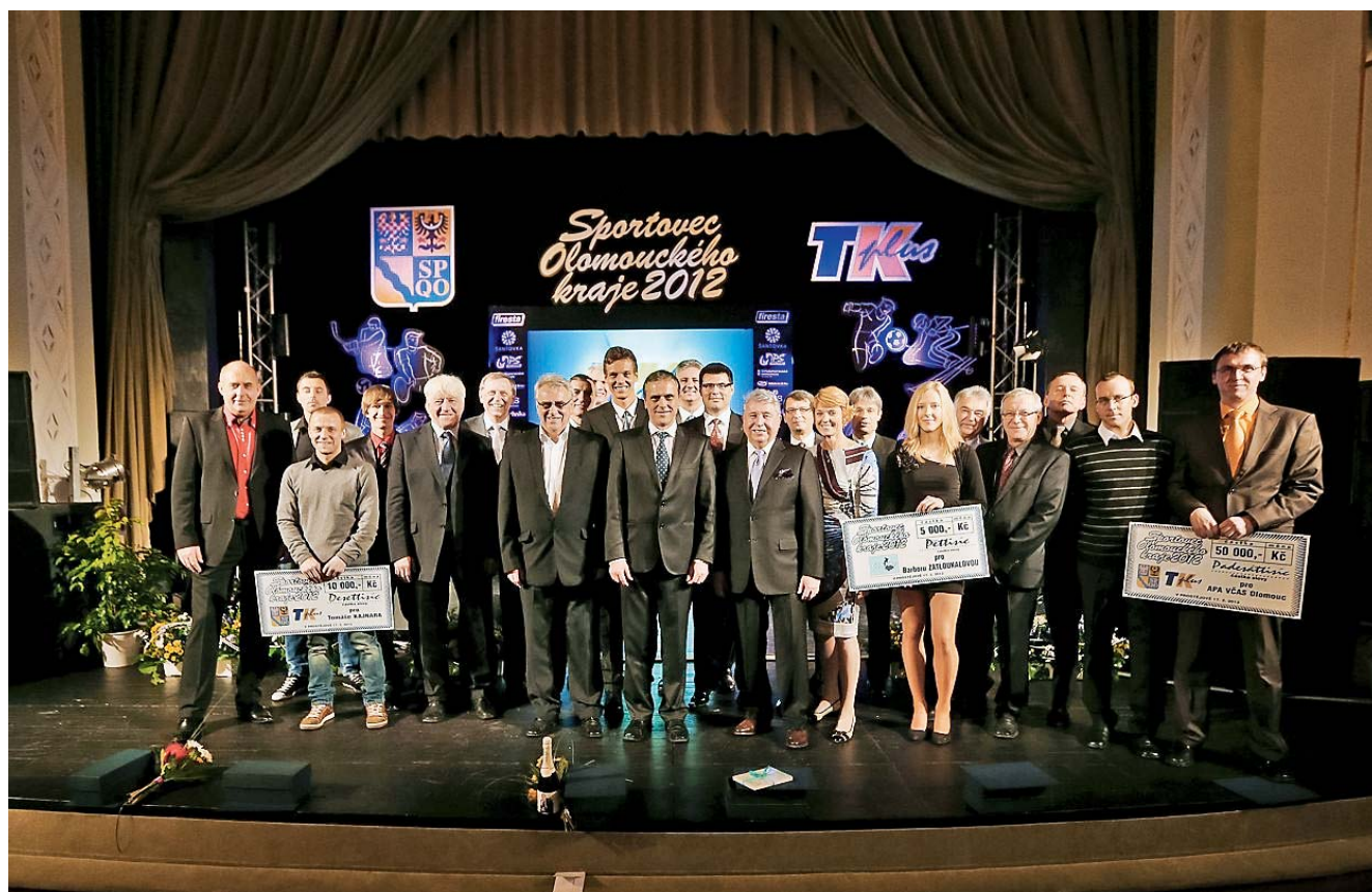
V anketě Sportovec Olomouckého kraje 2012 byli oceněni ti nejlepší.

Prostějov • Již po šesté byl nejlepším sportovcem Olomouckého kraje vyhlášen prostějovský tenista Tomáš Berdych. Sedmadvacetiletý člen úspěšného daviscupového týmu vyhrál tradiční anketu za rok 2012. Loňská sezona se Berdychovi nadmíru vydařila. Šestý hráč světa výrazně přispěl k zisku Davisova poháru, navíc získal dva ti-