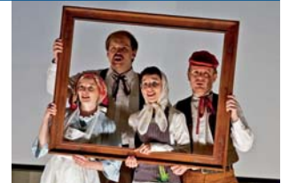
Ensemble Damian

tým dramaturgů si vyhrazuje právo učinit předvýběr. „Stejně tak to funguje při budování všech ostatních soutěžních sekcí, v nichž se utkávají dvě až tři desítky ze stovek přihlášených filmů,“ doplňuje Korda. Užší výběr snímků se bude následně prezentovat během festivalu s tím, že finální verdikt vyřkne nezávislá porota. Videa s maximální délkou 4:40 minut mohou zájemci nashílet na internetovou úložnu, zaheslovat a odkaz s heslem poslat na e-mail cermak@afoc.cz . Je nezbytné připojit celé jméno a kontaktní údaje (e-mail a telefon). Více na www.afoc.cz . | TZ