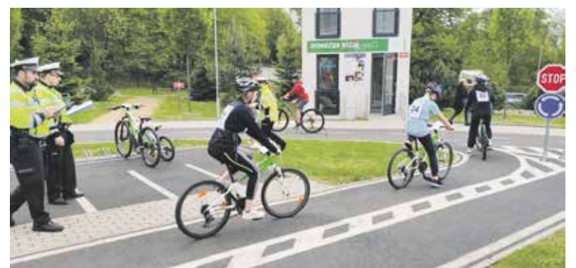
Krajské finále: Zábřeh 6. června

„Cílem soutěže je podněcovat a zvyšovat zájem žáků o dopravní výchovu, ověřovat znalosti a dovednosti žáků – cyklistů v uplatňování pravidel provozu