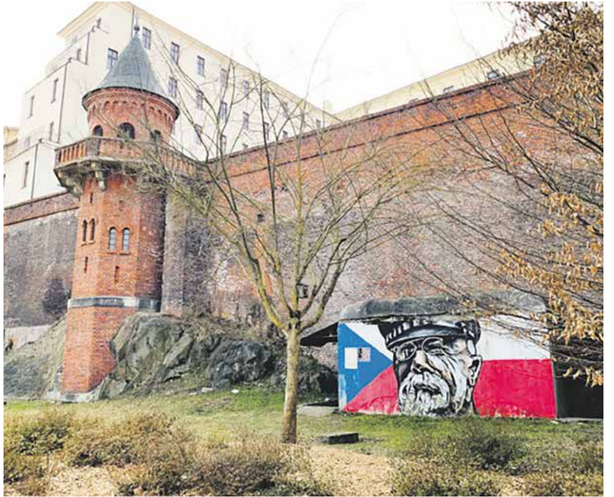
Bývalý kryt civilní obrany, který Institut Paměti národa využívá jako výstavní prostory, je v olomouckých Bezručových sadech.

V centrální části krytu je stále možné zhlédnout průřez toho nejzajímavějšího ze sbírky