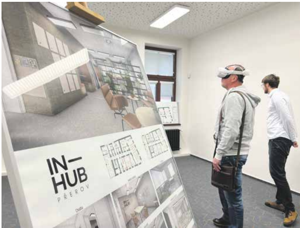
Přerovský IN-HUB bude inspirativním prostředím, kde lze pracovat a třeba i potkat nové partnery pro byznys.