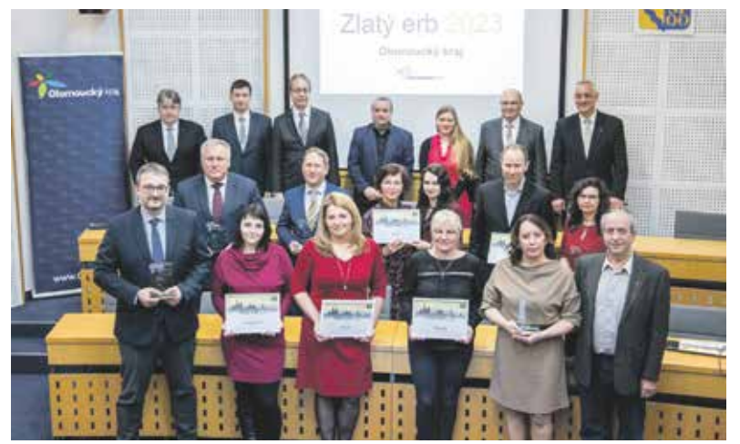
Ocenění se předávala v kongresovém sále krajského úřadu. Pořadatelem soutěže je spolek Český zavináč a vítězové krajských kol postupují do celostátního finále.

„Gratuluji vítězům letošního ročníku i všem starostkám a starostům, kteří webové stránky svých obcí neustále rozvíjí a zlepšují. Lidé díky tomu snadno najdou informace, které hledají, a ušetří si čas chozením na úřad – nebo se prostřednictvím obecních webů dozví o zajímavých