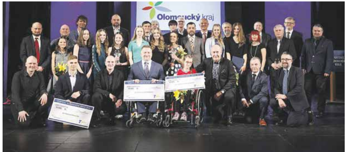
Předání cen se uskutečnilo v pondělí 20. března v prostějovském divadle.