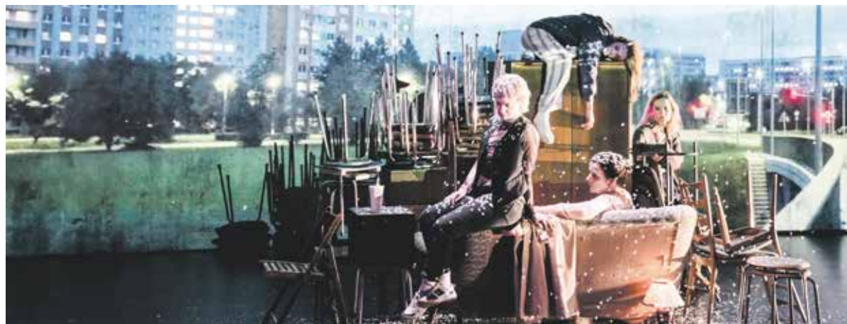
Dvanáctidenní program Divadelní Flory vyvrcholí premiérovým olomouckým hostováním jednoho z nejrenomovanějších evropských souborů. Thalia Theater Hamburg se v pondělí 22. 5. (na jevišti Moravského divadla Olomouc) představí s inscenací „Na člověku musí být vše krásné“ – strhující adaptaci románu Sashy Marianne Salzmanna, jenž byl v Německu oceněn jako Kniha roku.

Od 11. do 22. května se koná v krajském městě 26. Divadelní Flora. Jeden z největších tuzemských festivalů přivítá renomované osobnosti českého i zahraničního divadla. V průběhu dvanácti dnů pozve na více než šest desítek akcí zastřešených mottem Jinakost.