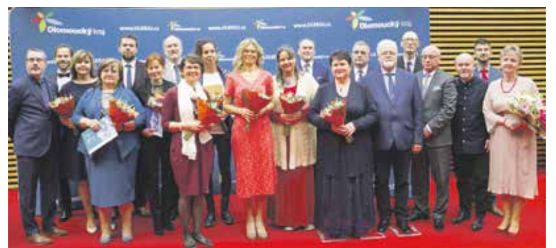
Oceněno bylo letos 21 pedagogů, speciální ceny udělili radní pro oblast školství a děkan Pedagogické fakulty UP.

„Poslouchat medailonky jednotlivých pedagogů, kteří si chodili pro ocenění, bylo pohlažením na duši. Každoročně oceňujeme práci, která mnohdy není vidět, a přitom je tak důležitá. Pro Olomoucký kraj je rozvoj vzdělávání prioritou. Všem kantorům patří velký dík za práci, kterou vykonávají,“ řekl při předávání ocenění hejtman Josef Suchánek. Pracovníkům středních škol, vyšších odborných, speciálních i základních uměleckých škol, dětských domovů, pedagogicko-psychologických poraden a domů dětí a mládeže se sídlem v Olomouckém kraji