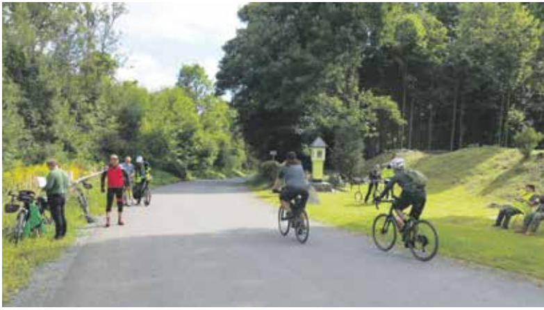
Akce Bílý kámen je určena nejen pro cyklisty, ale i pěší turisty.