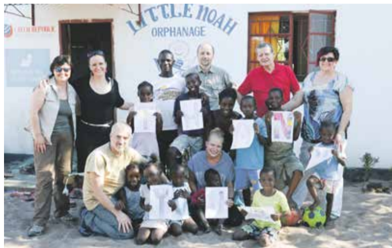
Díky Nadaci Malý Noe funguje v africké Zambii už desátým rokem dětský domov.