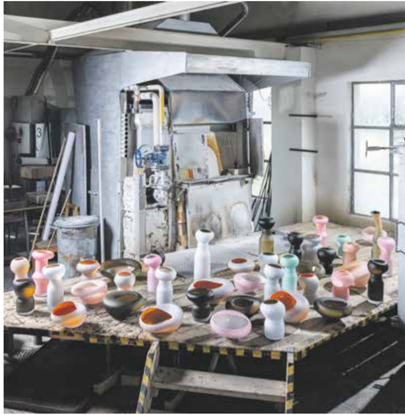
Ceny za umění vznikají ve sklářském ateliéru v centru Olomouce.

Autorem letošní podoby cen je sklářský výtvarník a designér David Valner, majitel a zakladatel designérského ateliéru Valner Studio v centru Olomouce, který pro ceny zvolil tvary vycházející z architektury budov, ve kterých se kultura odehrává, tedy divadel, muzeí a galerií napříč krajem. „Proces hledání tvarů spočívá ve fotografiích nebo skicích detailů architektury z různých úhlů. Z těchto fragmentů si následně obtahují některé konkrétní výrazné linie, které se stávají prvotním základem budoucího tvaru samotné ceny. Křivky, které si zaznamenám, následně rotuji podle středové osy do trojrozměrného objektu neboli do konkrétního tvaru samotné budoucí ceny. Z mnoha těchto tvarů, které jsem posbíral při cestách po Olomouckém kraji, následně vyberu tři, které se