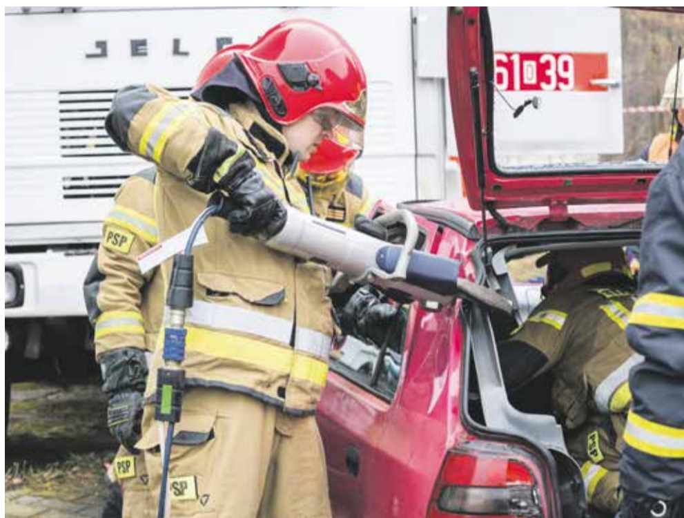
Připravenost všech složek IZS otestovalo mezinárodní cvičení u polských hranic.