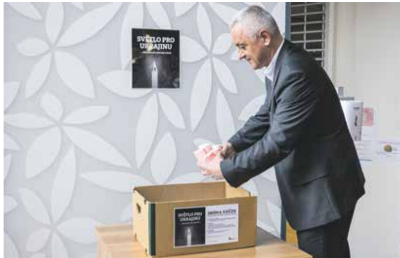
Jednou z charitativních akcí byla sbírka svíček v sídle kraje, ze kterých dobrovolníci vyrábějí zákopové svíce pro bojovníky na Ukrajině.

Hned po vypuknutí války se sešel Krizový štáb Olomouckého kraje a o pár dní později, 1. března, zřídilo hejtmanství v budově sídla kraje Krajské asistenční centrum (KACPU), a to ve spolupráci s Hasičským záchranným sborem Olomouckého kraje, policisty, záchranáři, zdravotníky, pracovníky Ministerstva vnitra České republiky a Univerzitou Palackého. Kapacitně ale nestačily ani nafukovací stany před sídlem kraje, jen za první čtyři dny centrum poskytlo pomoc stovkám lidí, kteří prchali před válkou – zejména ženám a dětem. Po týdnu se proto přesunulo asistenční centrum