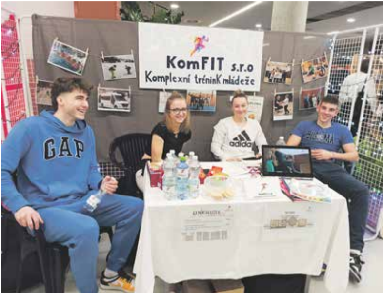
Studenti musí svoji fiktivní společnost prezentovat jako skutečnou, včetně propagačních materiálů, a přesvědčit porotu, že na trhu práce obstojí.

Jubilejní desátý ročník fiktivních firem letos na olomouckém Výstavišti Flora hostil celkem 21 společností z České republiky, Rumunska a Belgie. V unikátním školním projektu představují studenti podnikatelské nápady ve fiktivně založených společnostech. Na letošním ročníku byly k vidění cukrárna, pekárna, realitní kancelář, cestovní agentura, prodejny s chovatelským zbožím nebo vztahová poradna.