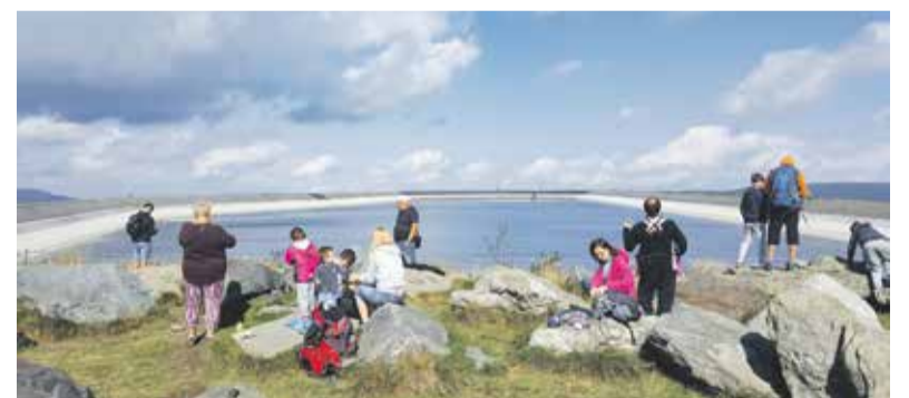
Letošní dotace mají směřovat především do rozvoje infrastruktury, která zlepší dostupnost turistických lokalit.

Finanční podporu tak rozdělí hejtmanství do čtyř dotačních titulů – nadregionální akce, rozvoj zahraničních vztahů, zkvalitnění služeb turistických center a rozvoj cestovního ruchu. Největší částku hejtmanství investuje do rozvoje infrastruktury cestovního ruchu, kam ze svého rozpočtu poskytne přes šest milionů korun.