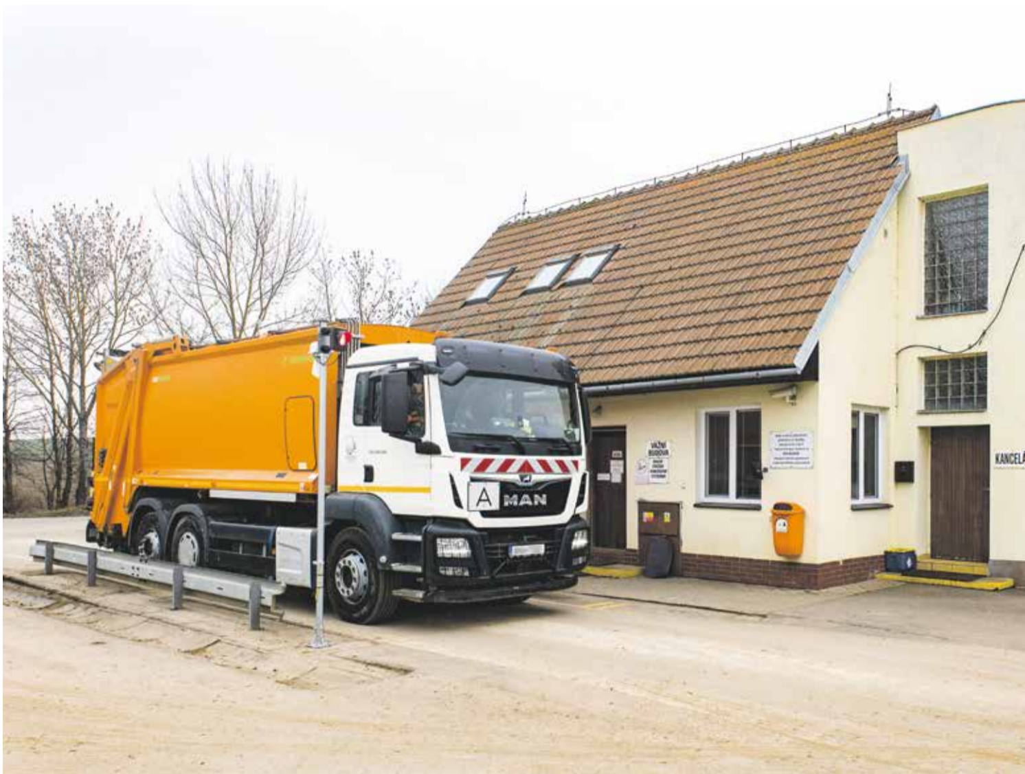
Svoz komunálního odpadu je sice samozřejmost, v následujících letech ale čekají obce i města změny v jeho ukládání.