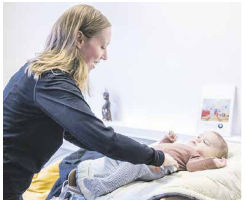
Zázemí Family Pointu v Olomouci mohou rodiče s dětmi využívat zdarma, v celém kraji má těchto míst vzniknout deset.

Výhledově tak ve městech po celém kraji vznikne dalších deset základních Family Pointů.