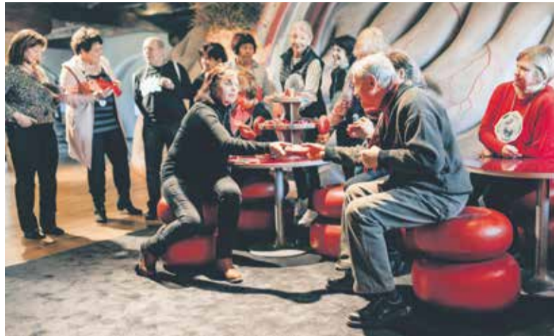
Vzdělávací programy pro seniory připravuje Pevnost poznání od roku 2016.

Kurz pro seniory se koná od 20. února každé pondělí a jeho účastníci se podívají do interaktivních expozic popularizačního centra Přírodovědecké fakulty UP. Budou mít příležitost vyzkoušet si i jednotlivé exponáty a také se budou učit v obřím modelu mozku, kde zjistí, jak tento super počítač lidského těla funguje, jak jej trénovat a využívat ke spokojenému životu. „S přibývajících roky je velmi důležité porozumět, jak naše tělo – a především mozek – fungují, protože jen tak pochopíme, čím můžeme projevy stárnutí zpomalit, a stále si tak užívat naplno života. S pomocí