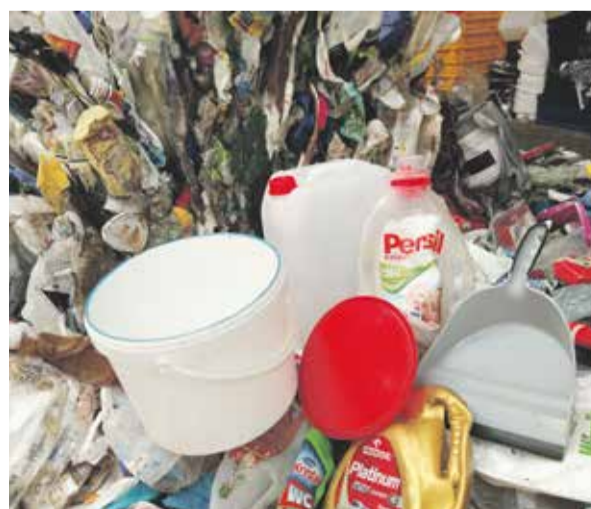
Z hromady plastového odpadu umí ve firmě vyrobit díly pro stavebnictví, dopravu nebo městský mobiliář.

Kvalitní vstupní surovinu bude schopna už zanedlouho MOSEVU dodávat plánovaná dotřídovací linka v Olomouci. Odpady budou automaticky dotříděny pro