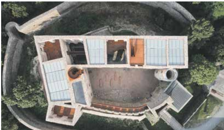
Hrad Helfštýn na Přerovsku prošel v minulých letech rozsáhlou rekonstrukcí.