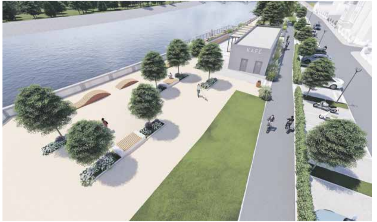
Takto by mělo nábřeží vypadat po skončení všech prací.