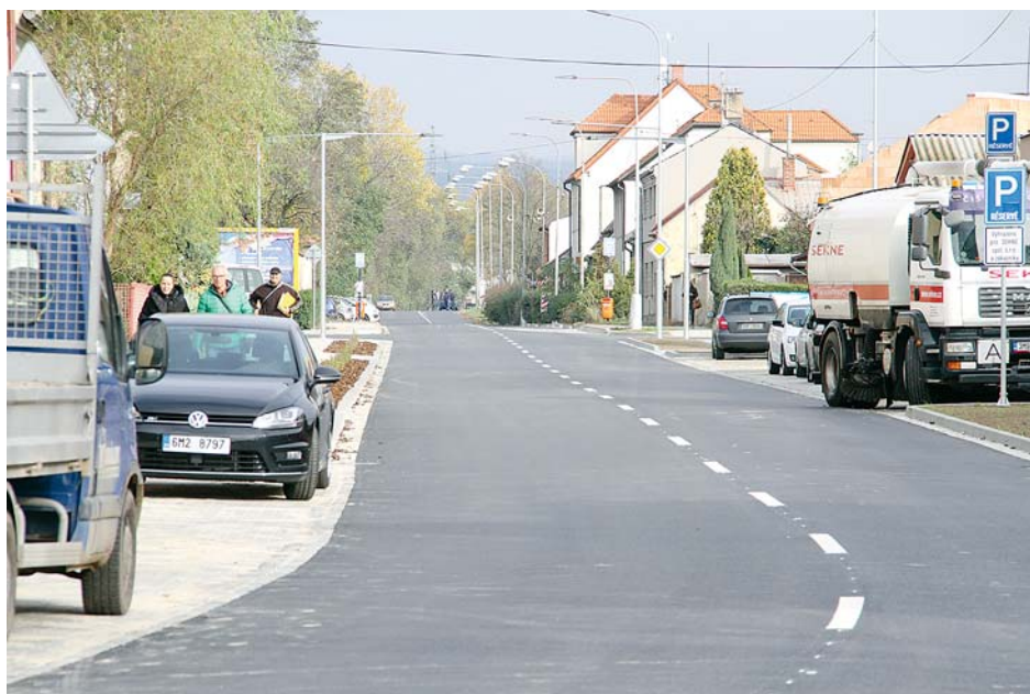
■ Hamerská ulice v Olomouci prošla v uplynulých pěti měsících kompletní rekonstrukcí. Na projektu se podílelo i město Olomouc.

Rozbité cesty na severu kraje nejsou žádným tajemstvím. Hejtmanství se ale