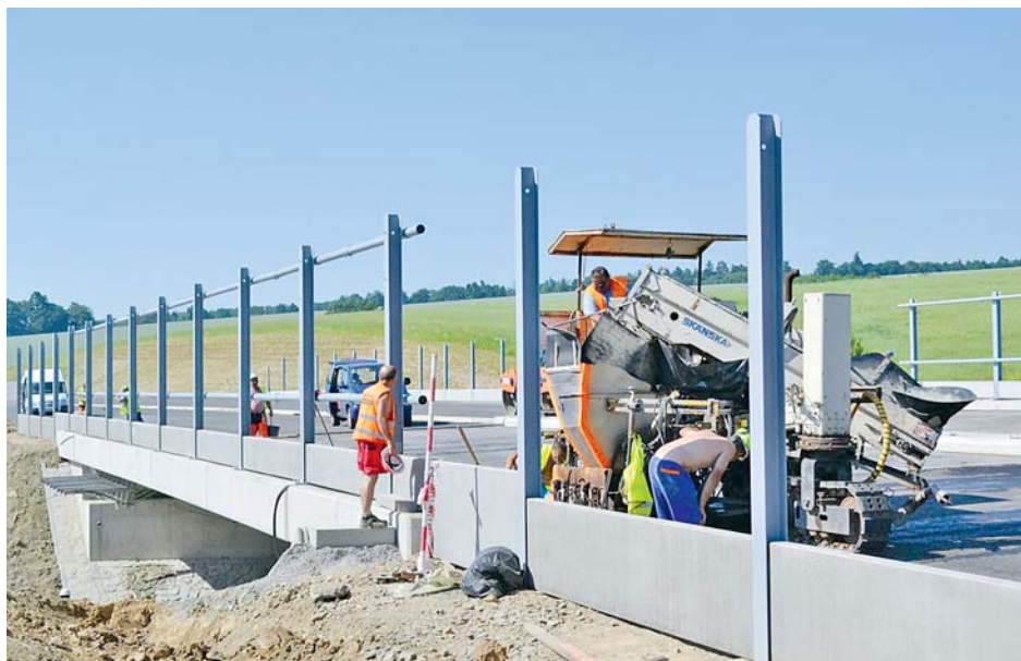
■ Silnici z Hanušovic do Polska čeká rekonstrukce, která je důležitá pro rozvoj cestovního ruchu.

V červnu podpořila modernizaci cesty Evropská unie, o měsíc později potvrdil finanční podporu také stát. Díky dotacím tak Olomoucký kraj zaplatí za rozsáhlou rekonstrukci jen 10 milionů korun. Příští rok