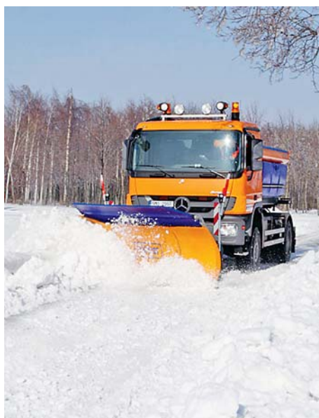
■ Oranžové vozy Správy silnic Olomouckého kraje budou letošní zimu odklízet pouze silnice II. a III. tříd v majetku kraje.

Poprvé v historii Olomouckého kraje nebude krajská správa silnic během zimy udržovat komunikace I. třídy. Stát si na zajištění této služby nově vybral společenství tří soukromých firem. Hejtmanství se proti takovému kroku ohradilo. „Jsem sice zastáncem hospodárnosti, ale ne takové, která odporuje zdravému rozumu. Vždyť úseky silnic I. třídy teď naše sypače pouze projedou se zdviženými pluhy, aby se po nich mohly dostat na komunikace nižších tříd, které už udržovat mohou,“ řekl hejtman Olomouckého kraje Ladislav Okleštěk. Silničáři už kvůli této změně připravovali systém okruhů, na kterých tradičně zimní údržbu prováděli. Z původních sedmaosmdesáti jich zůstalo třiasedmdesát. „Kraj bude samozřej-