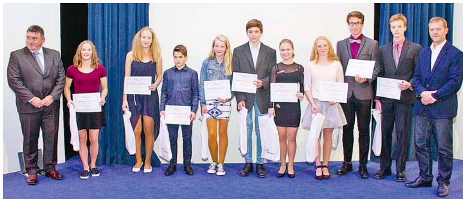
■ Držitelé ocenění Talent Olomouckého kraje.