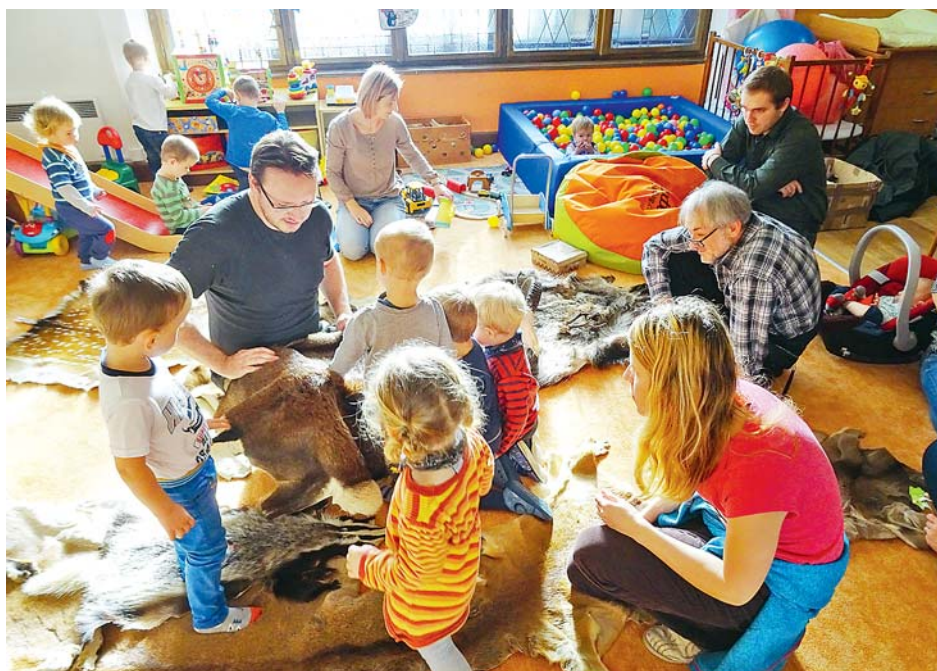
■ Lekce lesní pedagogiky mají v centru Heřmánek veliký úspěch.

Vítězství v soutěži pro nás bylo důležité, vnímali jsme jej jako zadostiučinění za veškerou naši práci. Bylo novou motivací pro nás, náš tým dobrovolníků a spolupracovníků, protože při práci v neziskové organizaci orientující se primárně na rodiny s dětmi