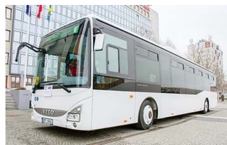
■ Víceúčelový autobus je až do konce roku plně obsazený. Rezervace už nyní KIDSOK přijímá na prvních pět měsíců příštího roku.

Od jara podnikl autobus více než 120 jízd a najezdil téměř sedmáct tisíc kilometrů. Jeho služeb mohou využívat především organizace zřizované Olomouckým krajem, jako jsou školy, domovy pro seniory nebo centra sociálních