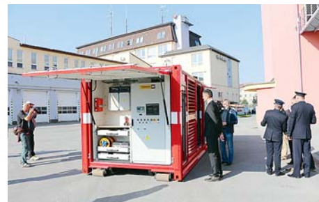
■ Energetické centrum je uloženo v kontejneru a hasiči ho mohou převézt na jakékoli místo v kraji.