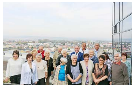
■ Členové Českého svazu bojovníků za svobodu na setkání v sídle krajského úřadu.

Společné setkání členů svazu s představiteli kraje proběhlo v polovině října v sídle krajského úřadu. Lidé, kteří byli za války nacisty vězněni, nemají, na rozdíl od přímých účastníků odboje, nárok na finanční příspěvek od státu. Kraj to tímto kompenzuje. „Tito lidé se stali obětí velkého zla. Náš příspěvek na podporu léčby to pochopitelně nemůže napravit, ale dáváme tím najevo naši úctu k těm, na které nacistická tyranie tvrdě dopadla,“ řekl Ladislav Okleštěk, hejtman Olomouckého kraje.